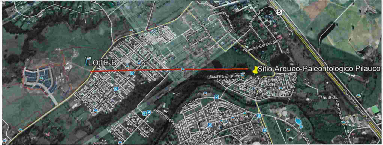
Imagen N°5: Se muestra la distancia de aproximadamente 1 km, que existe entre el sitio Arqueo-Paleontológico Pilauco y el proyecto "Inmobiliario Macro-Pilauco II".

8.- Que, una vez recibida la información por parte del titular, respecto de lo solicitado en el acta de fiscalización del 2 de abril del presente año, es posible indicar lo siguiente: