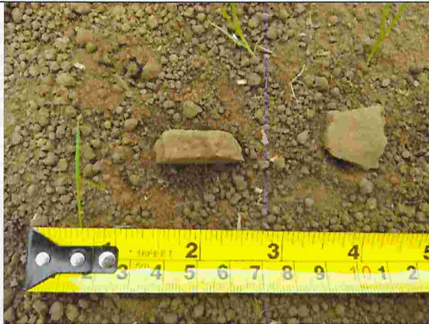
Fotografía N°3: Fragmento cerámico encontrado en lote D