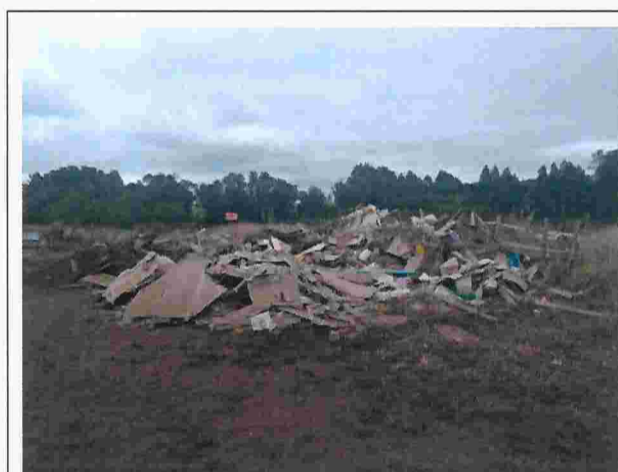
Fotografía N°1: Acopio con residuos de la construcción del lote D