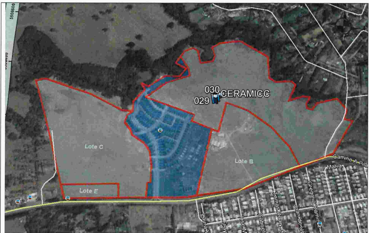
Imagen N°3: Ubicación espacial y georreferenciada de los puntos donde se encontraron restos cerámicos en Lote D, con respecto a los otros lotes.

Lo anterior, queda corroborado con las siguientes imágenes y fotografías presentadas a continuación: