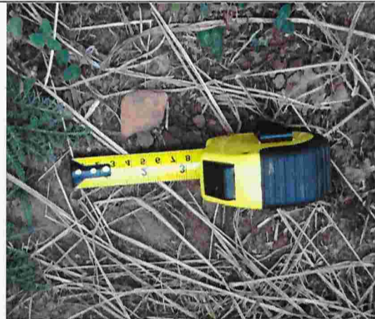
Fotografía N°8: Fragmento cerámico encontrada en Lote D.