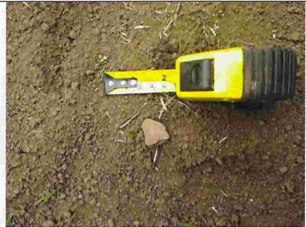
Fotografía N°4: Fragmento cerámico encontrado en lote D