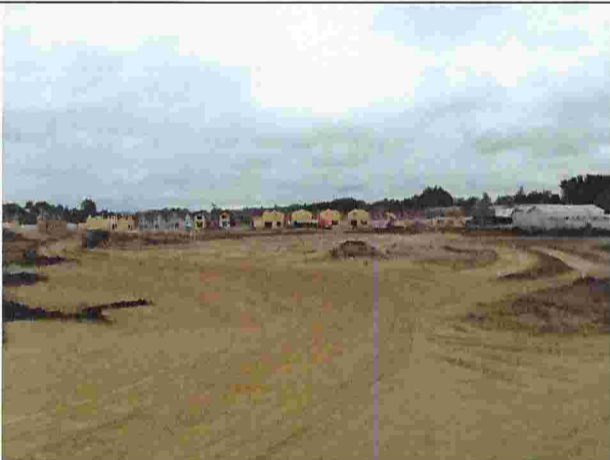
Fotografía N°7: Escarpe en Lote B, al fondo casas en construcción del Lote A