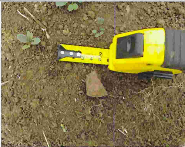
Fotografía N°5: Fragmento cerámico encontrada en lote D