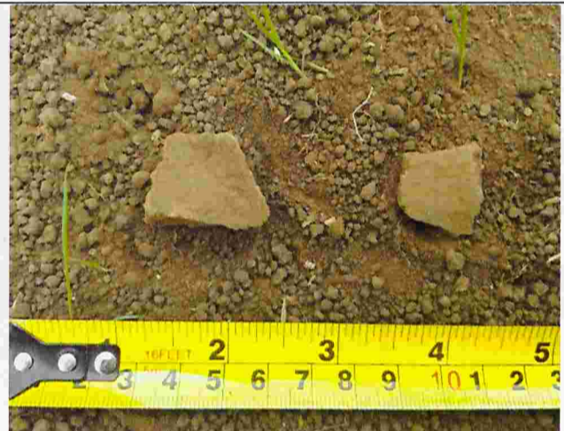
Fotografía N°6: Fragmento cerámico encontrada en lote D