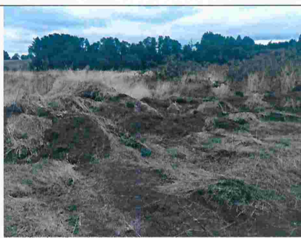
Fotografía N°2: Movimiento de tierra en lote D.