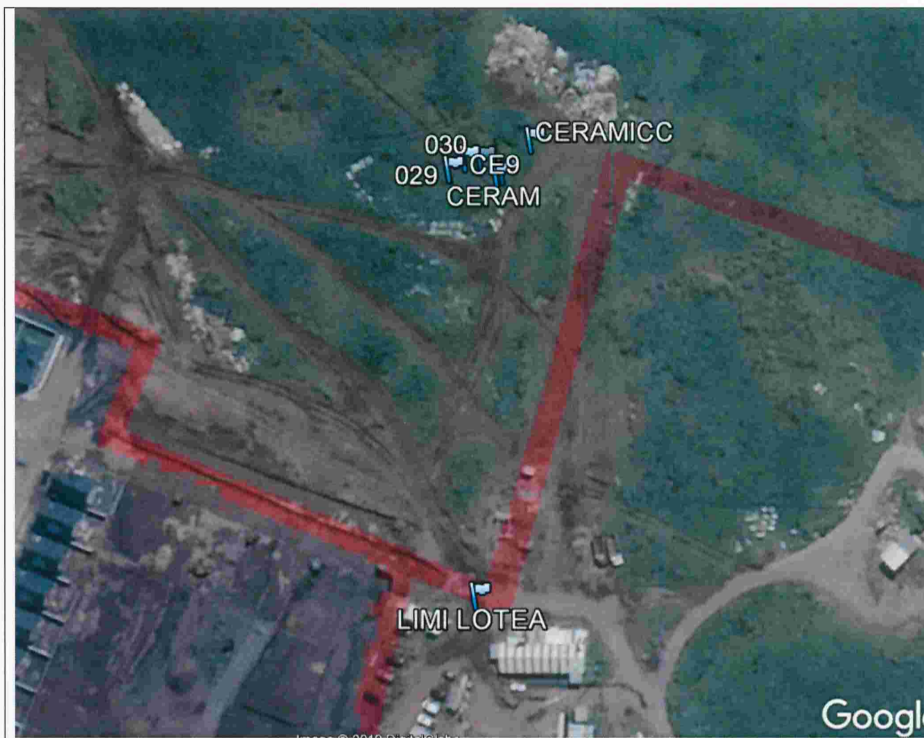
Imagen N°4: Detalle de la ubicación espacial y georreferenciada de los puntos donde se encontraron restos cerámicos en Lote D, durante la actividad de inspección ambiental del 02-04-2019.