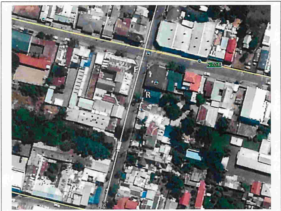
Figura 1. Ubicación fuente emisora y receptor afectado, donde la medición se realizó en el Receptor 1 (Denuncia ID 6-XVI-2018)