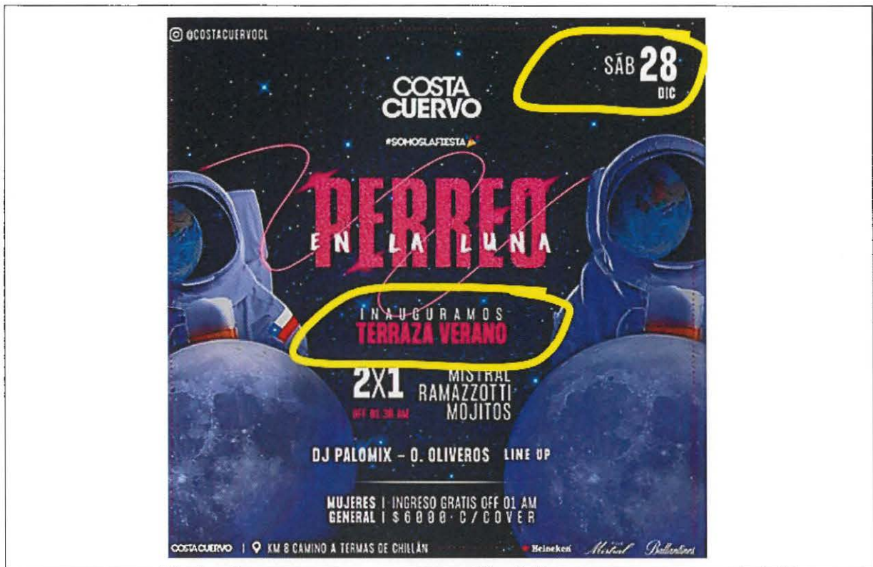
Figura 3. Anuncio web Inauguración en portal web https://www.facebook.com/costacuervoCL/

Las mediciones de ruido de fondo generado por la fuente de interés (Discoteca Costa Cuervo), se inician la noche 07 de enero de 2020 (horario nocturno 22:30 hrs - Figura N° 2), sin embargo, deben repetirse en una segunda medición el 19.01.2020 (horario nocturno 01:10 am a 674 metros al oriente de la fuente – Figura N° 4), toda vez que en el último caso se producen condiciones semejantes a la medición de la fuente y en un lugar homologable en términos de ruido de fondo. Los resultados se presentan a continuación: