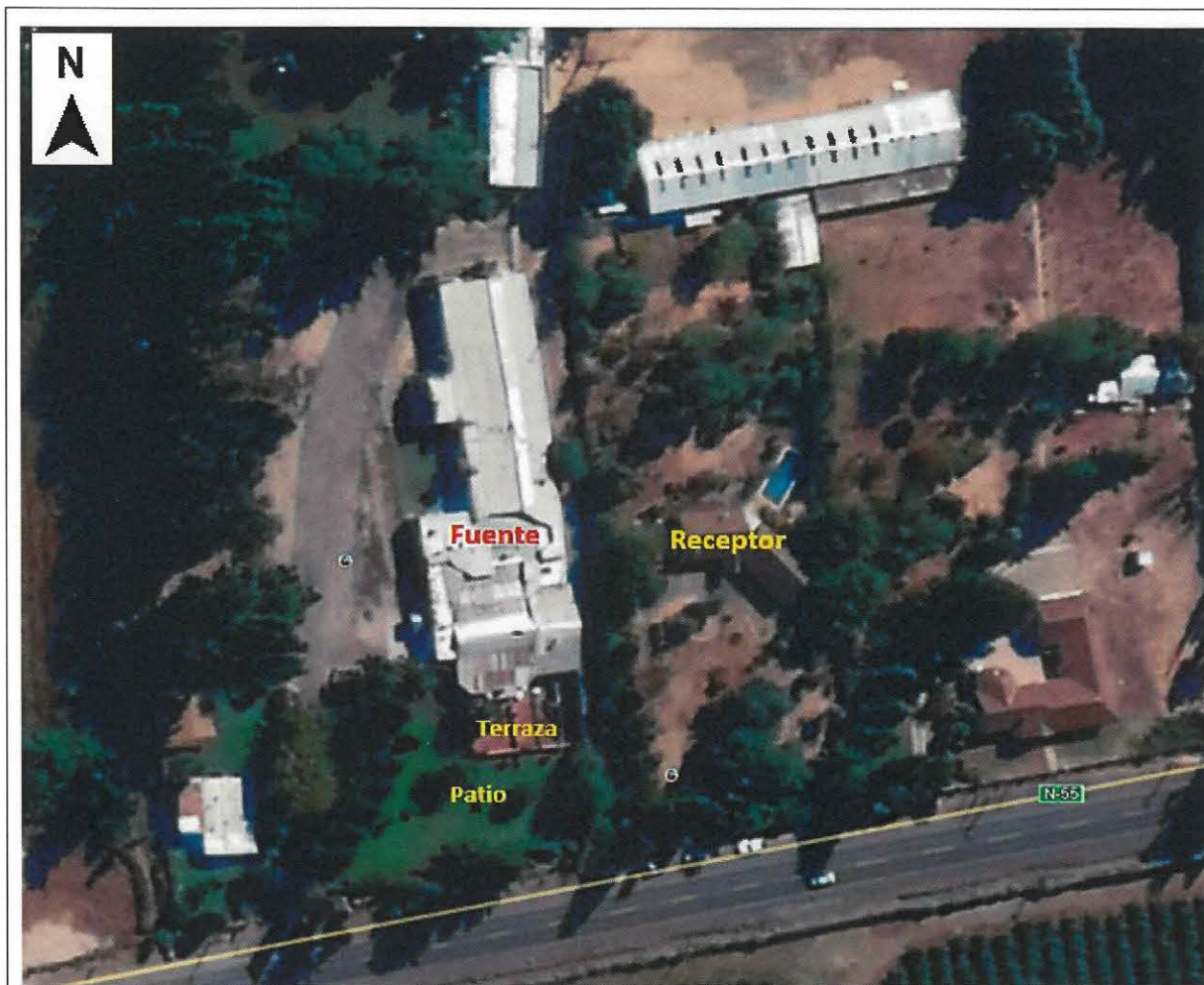
Figura 1. Ubicación fuente emisora y receptor afectado, donde la medición se realizó en el Receptor 1 (Denuncia ID 37-XVI-2019)

La Unidad Fiscalizable antes descrita, no cuenta con Resolución de Calificación Ambiental, conforme lo dispuesto en el artículo 10 de la Ley 19.300, de Bases Generales del Medio Ambiente.