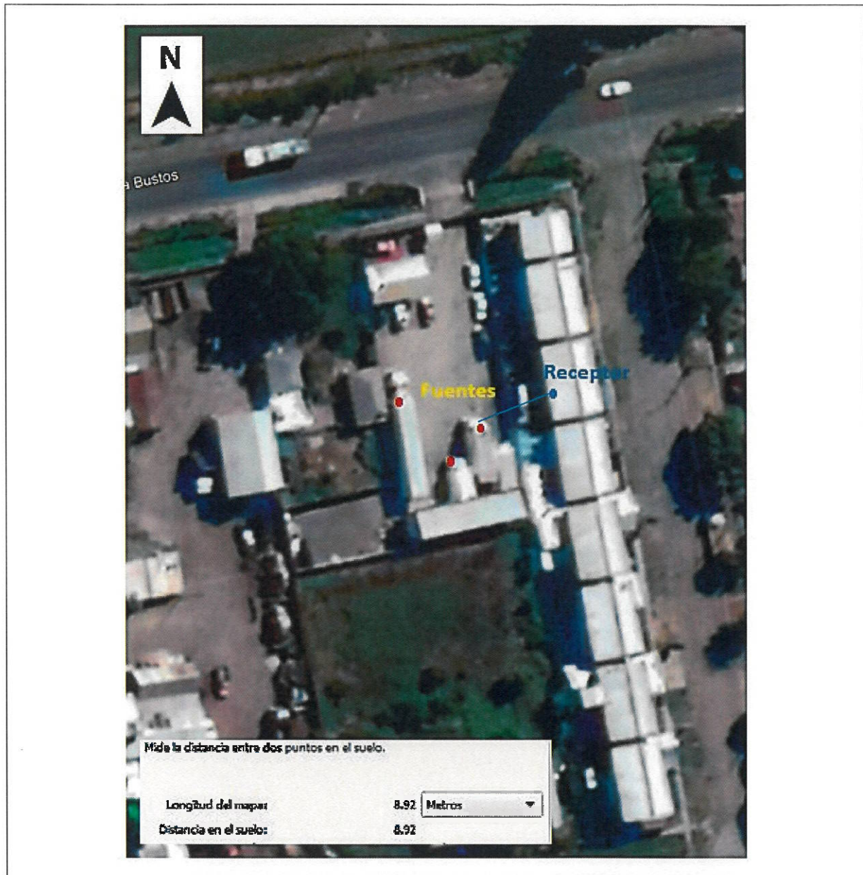
Figura 1. Ubicación fuente emisora y receptor afectado, donde la medición se realizó en el Receptor (Denuncia ID 02-XVI-2020)

La Unidad Fiscalizable antes descrita, no cuenta con Resolución de Calificación Ambiental, conforme lo dispuesto en el artículo 10 de la Ley 19.300, de Bases Generales del Medio Ambiente.