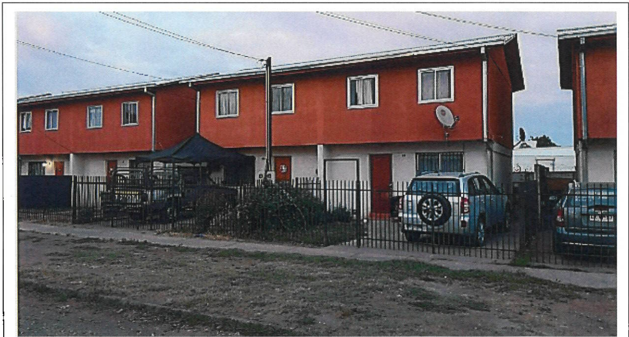
Figura 4. Fotos de viviendas de denunciantes 27.12.2019 tomada desde el Oriente.