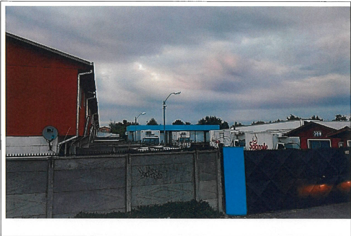
Figura 3. Fotografías de referencia 27.12.2019, tomada desde acceso norte de la Unidad Fiscalizable.

No se realizan mediciones de ruido de fondo debido a no se percibe la influencia de este al momento de la fiscalización. Además, la actividad se desarrolla en una zona urbana, correspondiente a la Zona III del DS 38/11 MMA .