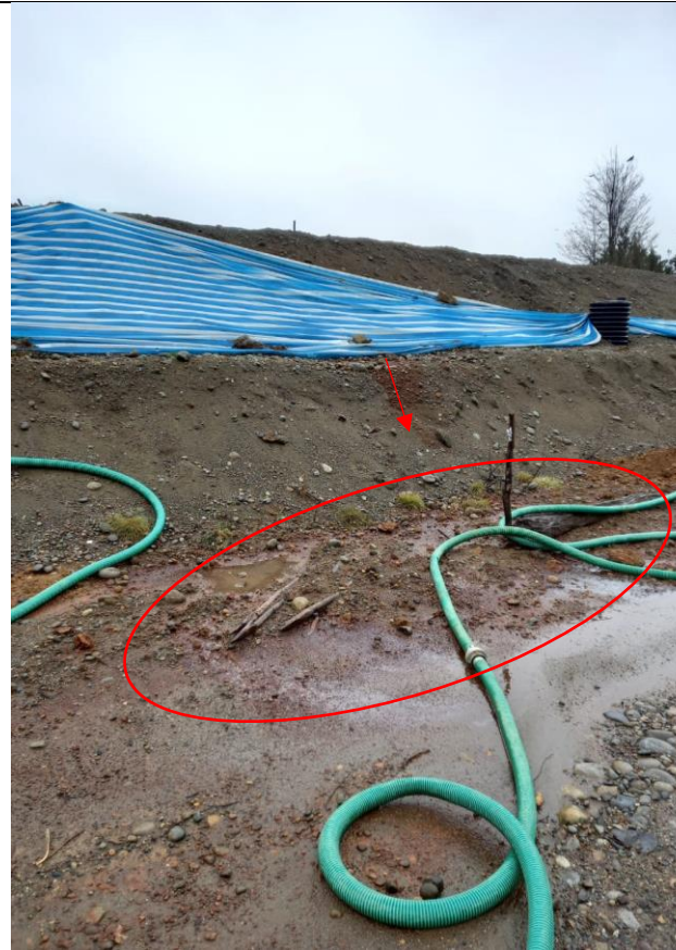
Fotografía N°5: Se observa escurrimiento de lixiviados por talud hasta la base de la masa de residuos en lado Norte.