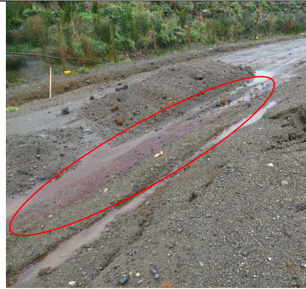
Fotografía N°12: Se constata lixiviados en lado Este.