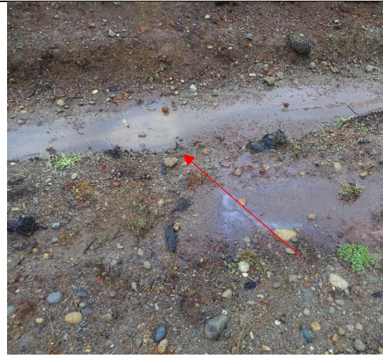
Fotografía N°13: Se observa lixiviado que escurre hacia canal de aguas lluvias Oeste.