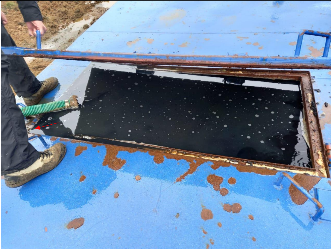
Fotografía N°14: Se observa tolva de acopio de lixiviados a máxima capacidad con escurrimiento lateral (flecha roja).