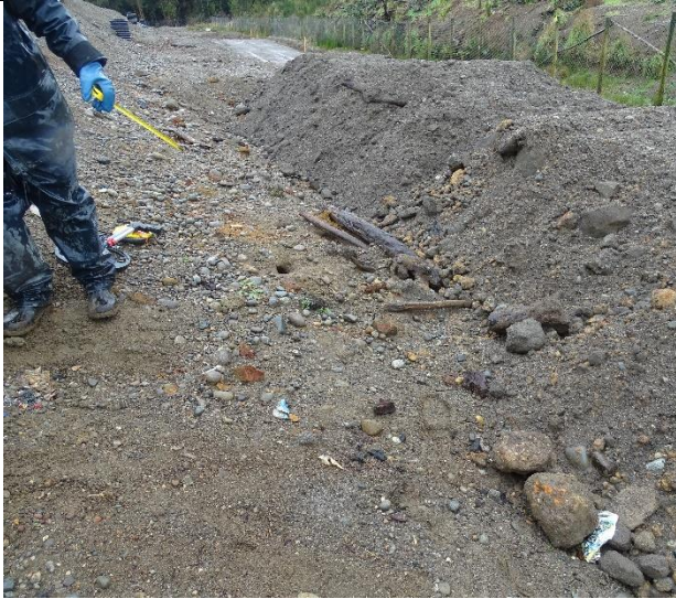
Fotografía N°10: Se observan orificios de vectores (ratones).