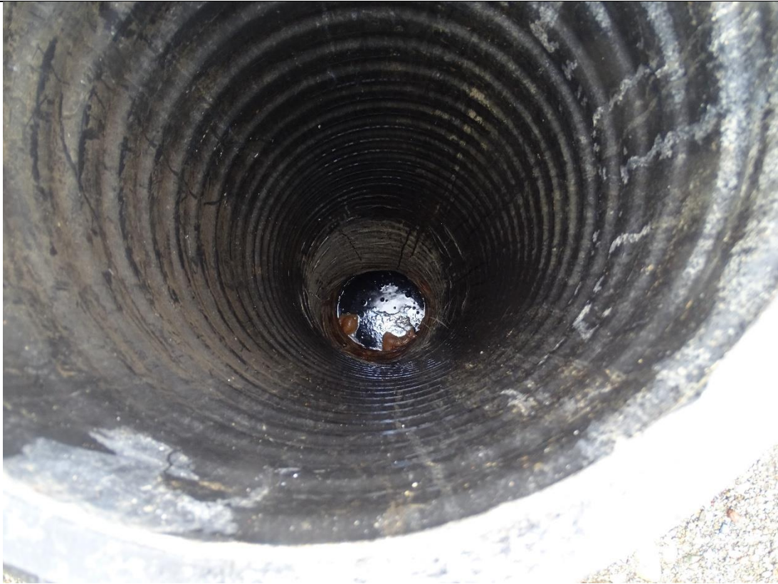
Fotografía N°8: Se constata existencia lixiviados en chimeneas de ventilación. Se observan burbujas.