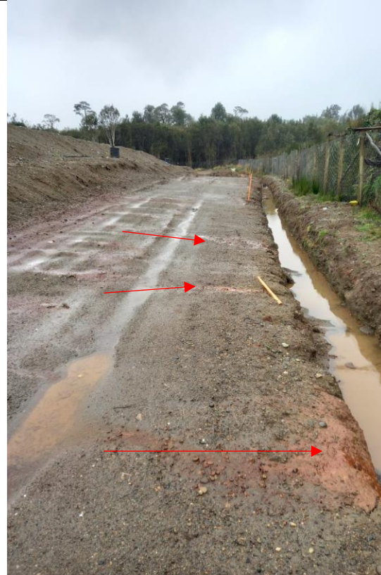
Fotografía N°11: Se observa escurrimiento de lixiviados hacia canal de aguas lluvias Este.