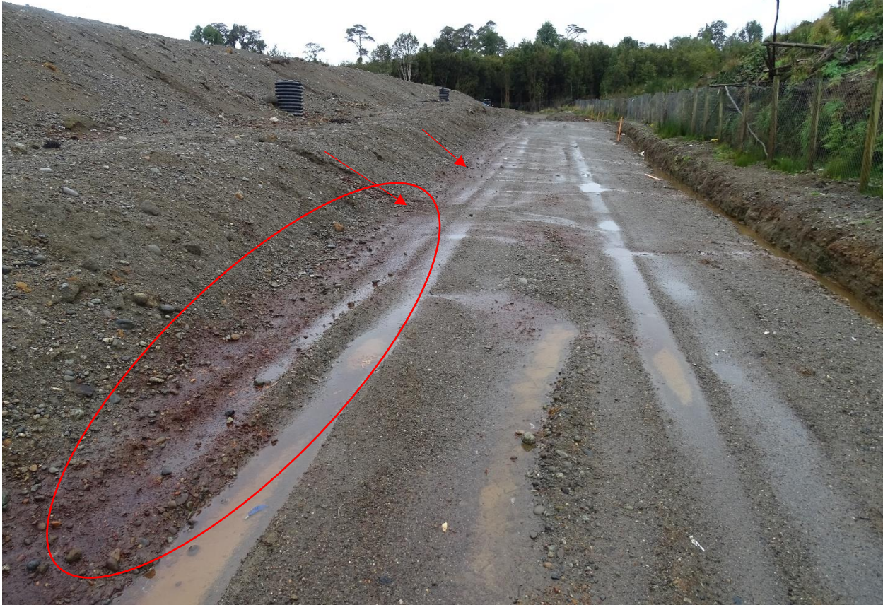
Fotografía N°9: Se observan manchones de lixiviados en la base de la masa de residuos en lado Este.