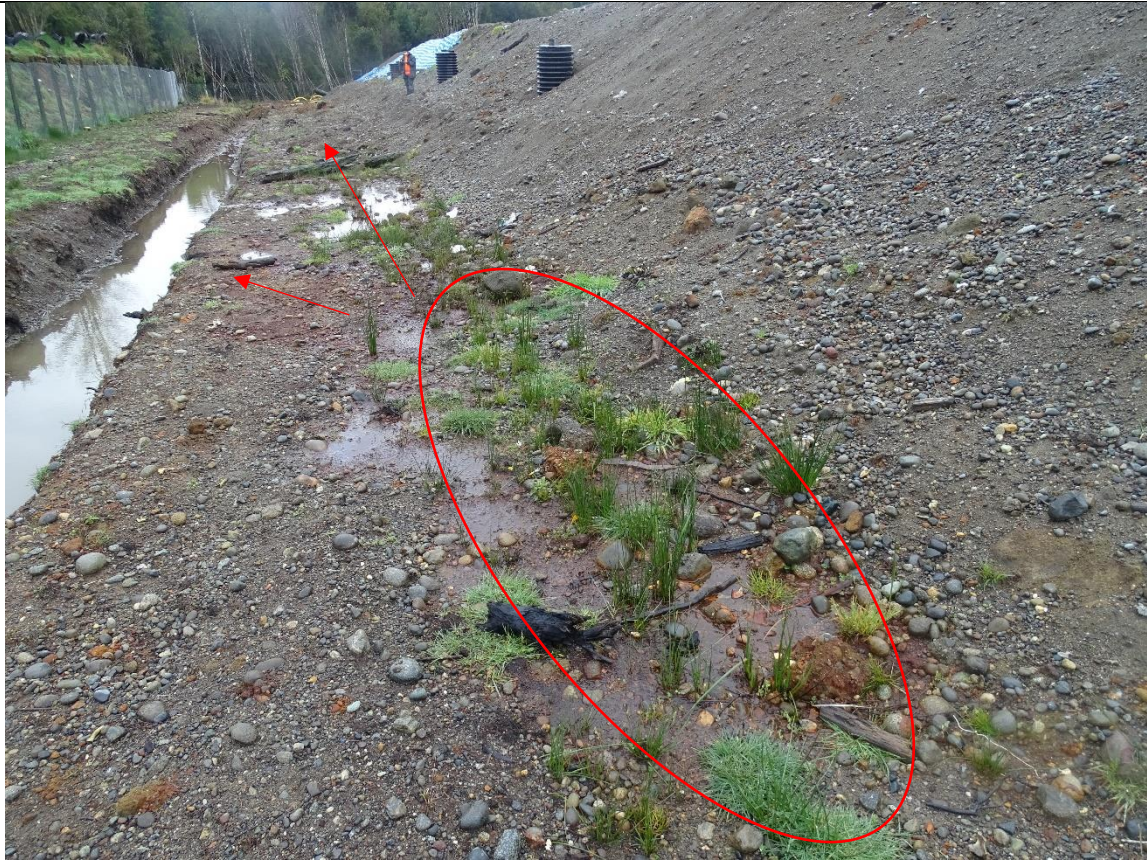
Fotografía N°3: Se observa lado Oeste de la masa de residuos con afloramiento de lixiviados.