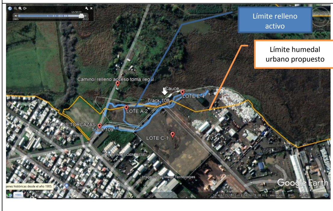
Figura 2. Recorrido de inspección ambiental de fecha 07-10-2022. La polilínea de color naranja corresponde al límite del humedal urbano propuesto, que coincide con el límite del Sitio Prioritario para este sector.