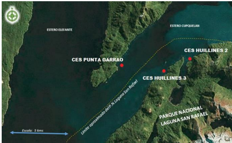
Figura 1. Ubicación del Proyecto