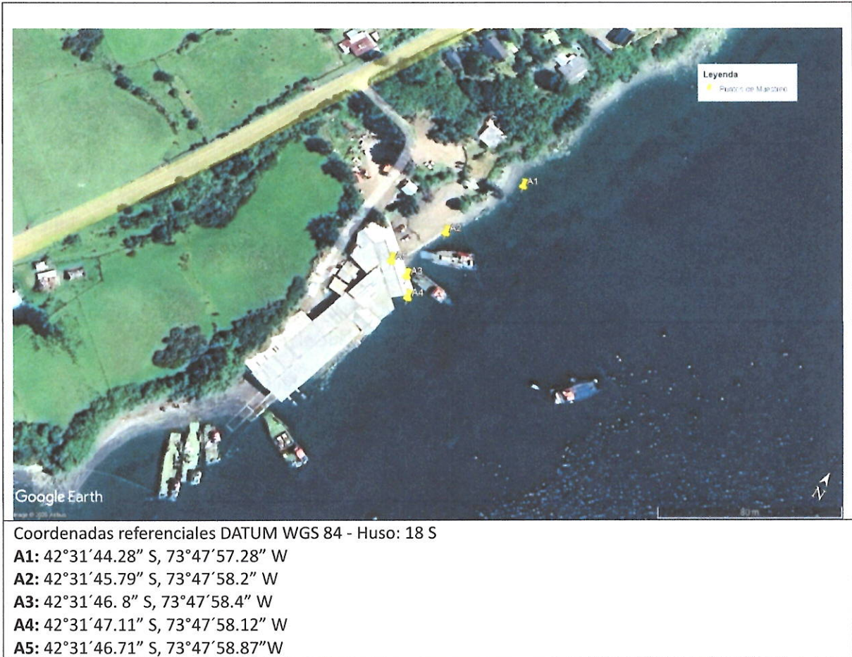
Imagen N°1: Mapa referencial de ubicación de las estaciones de muestreo