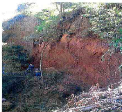
Quebrada de Las Petras