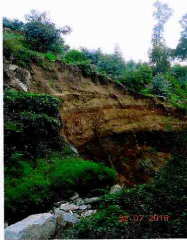
Quebrada de Las Petras, sin canalización de aguas lluvias.

10° En este contexto, los hechos constatados ponen de manifiesto la existencia de riesgos, tanto para la vida y salud de las personas, como para el medio ambiente, entre ellos: