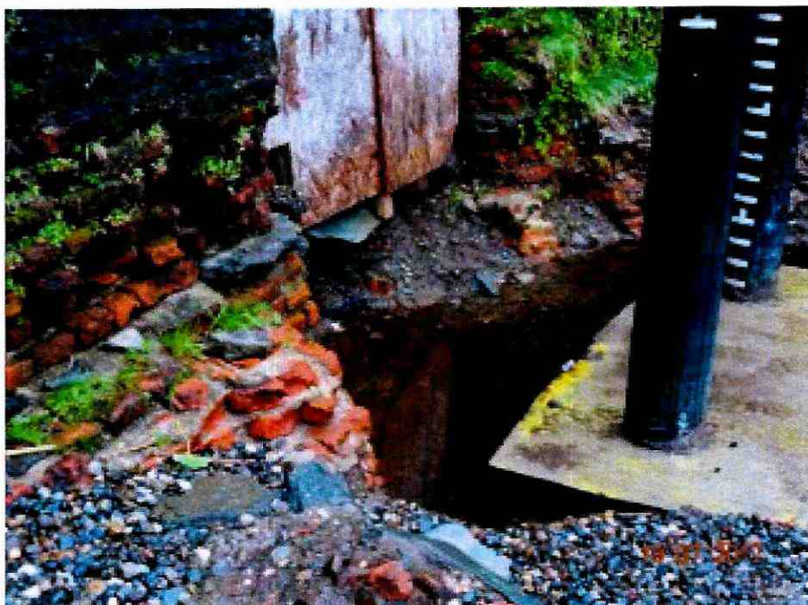
Imagen N°2: Sector de instalación de pilotes. Se observa sólo parte de la zona afectada del muro, ello atendido que el resto se encuentra inundado 2 .