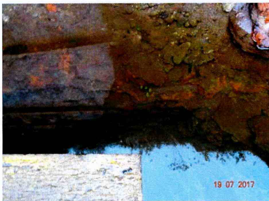
Imagen N°3: Se observa porción de muro afectado por la excavación de cubo, con el objetivo de la instalación de pilotees. La afectación quedó sumergida por el ingreso de agua de mar y sedimento. 3

23° Que, de esta forma, al momento de ser paralizadas las obras, en razón de lo dispuesto en el Ord N°2130, de fecha 11 de mayo de 2017, de la Secretaría Técnica del Consejo de Monumentos Nacionales, no se contemplaron medidas de resguardo para el Monumento Histórico Castillo San Sebastián de La Cruz. Razón por la cual esta construcción se encuentra expuesta al oleaje directo, sin ningún tipo de contención. A su vez,