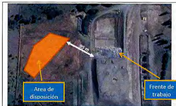
Fotografía 29, Informe DFZ-2016-912-XI-RCA-IA Fecha: 19 de mayo de 2016 Descripción Medio de Prueba: En la figura se muestra la ubicación del área donde se observó la disposición de lodos