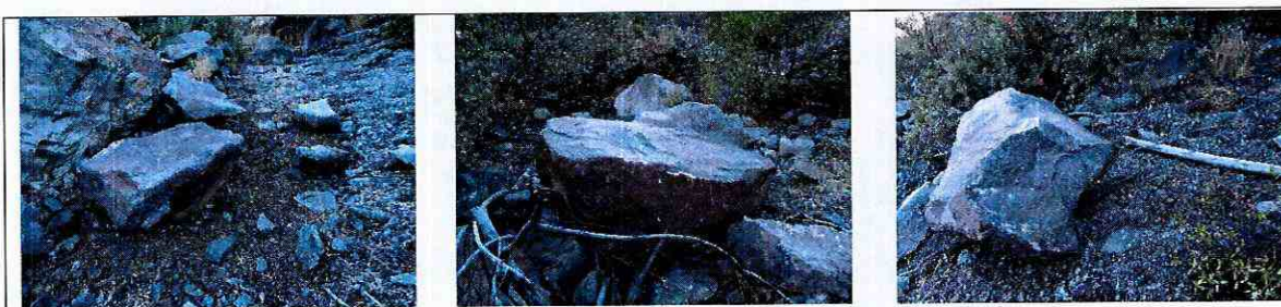
Fotografías 1, 2 y 3: Se aprecian las 3 rocas constatadas en la inspección del 12 de junio de 2018. Según estimación visual, las rocas que han caído en terrenos agrícolas desde la Mina UVA varían en su tamaño, aproximadamente entre 0,8 [m] y 1,5 [m] de altura y entre 1 [m] y 2 [m] de ancho.

19. Que, las rocas que cayeron en la propiedad del Sr. Leleux, detuvieron su marcha en un lugar que dista a 382 metros de la vivienda más cercana, y tenían las dimensiones que se exponen en las siguientes fotografías 1 :