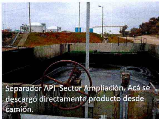
Separador API Sector Ampliación. Acá se descargó directamente producto desde camión.