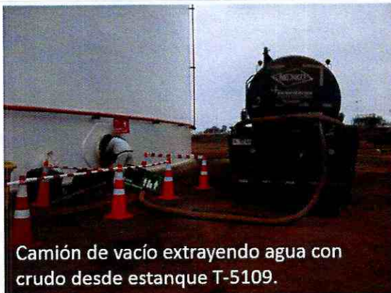
Camión de vacío extrayendo agua con crudo desde estanque T-5109.