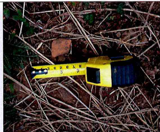
Fotografía N°8: Fragmento cerámico encontrada en Lote D.