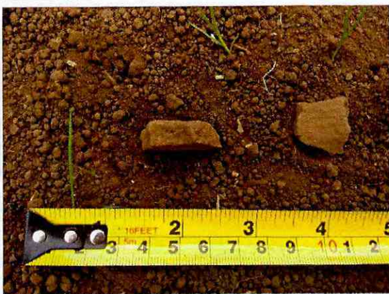
Fotografía N°3: Fragmento cerámico encontrado en Lote D.