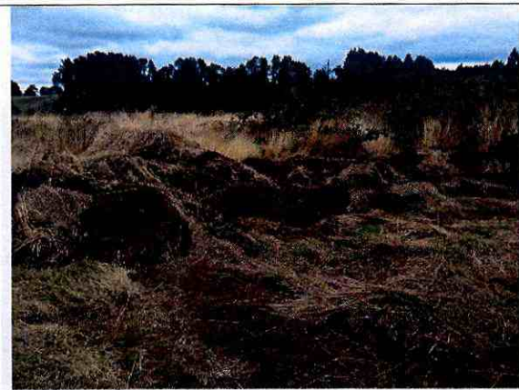
Fotografía N°2: Movimiento de tierra en lote D.