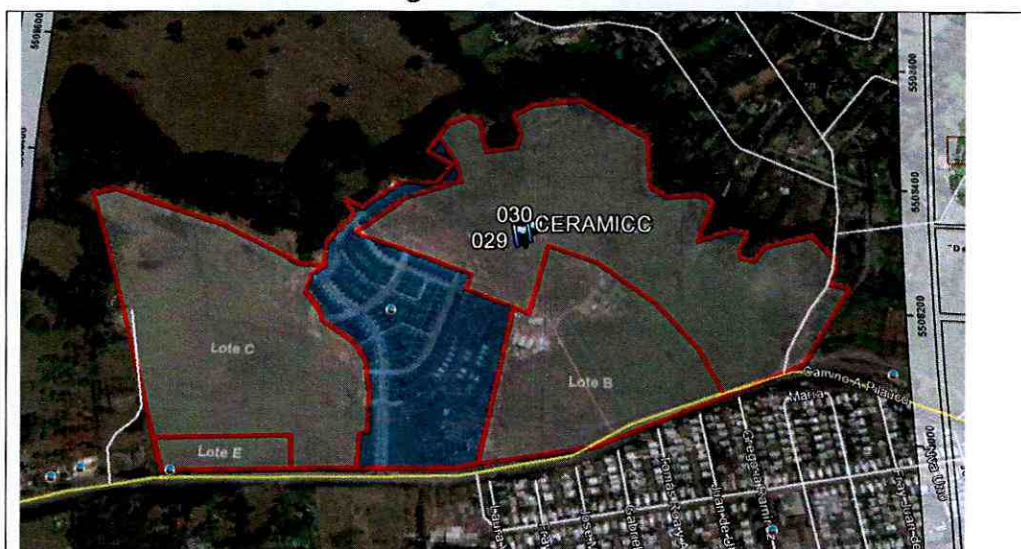
Imagen N°3: Ubicación espacial y georreferenciada de los puntos donde se encontraron restos cerámicos en Lote D, con respecto a los otros lotes.

23. Por su parte, el registro fotográfico de los hallazgos detectados, esto es, movimiento de tierra y escarpe en el Lote B, y la declaración de los trabajadores de la faena entrevistados, se procede a mostrar a continuación: