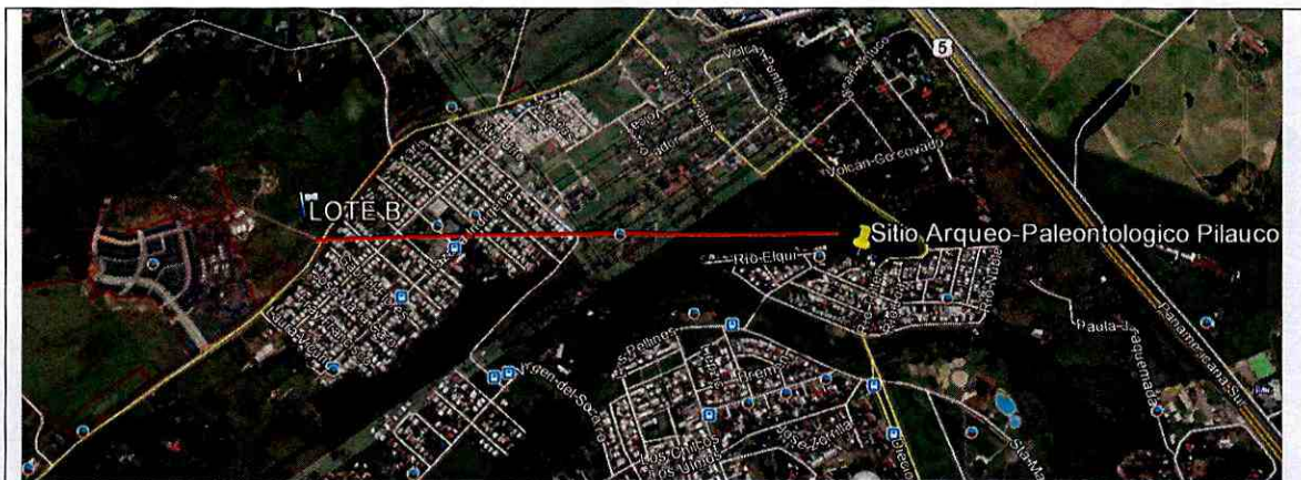
Imagen N° 4.

Imagen N°5 del Memorándum 018/2019: Se muestra la distancia de aproximadamente 1 km, que existe entre el sitio Arqueo-Paleontológico Pilauco y el proyecto “Inmobiliario Macro-Pilauco II”.