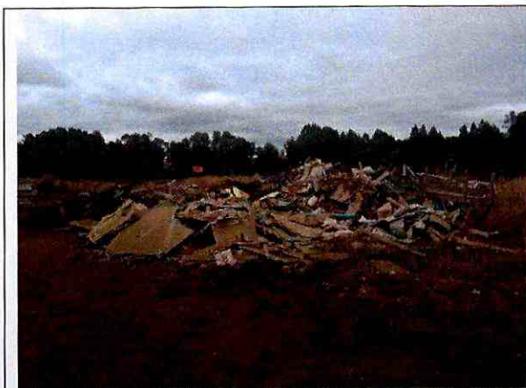
Fotografía N°1: Acopio con residuos de la construcción del lote D.

24. Asimismo, el registro fotográfico de los hallazgos detectados para el hecho D) señalado anteriormente en el considerando 13, esto es, el acopio de material de escarpe, basura, acopio de material de construcción, en el lote D, donde se constató la existencia de fragmentos de cerámicas en superficie, lo que de acuerdo a lo señalado por las arqueólogas del CMN que participaron de la inspección ambiental, constituye un sitio arqueológico, es el siguiente: