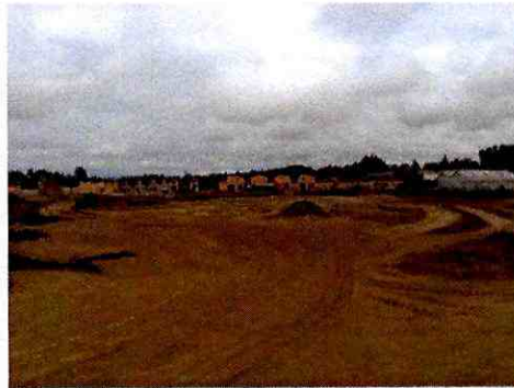
Escarpe en Lote B, al fondo casas en construcción del Lote A

24. Asimismo, el registro fotográfico de los hallazgos detectados para el hecho D) señalado anteriormente en el considerando 13, esto es, el acopio de material de escarpe, basura, acopio de material de construcción, en el lote D, donde se constató la existencia de fragmentos de cerámicas en superficie, lo que de acuerdo a lo señalado por las arqueólogas del CMN que participaron de la inspección ambiental, constituye un sitio arqueológico, es el siguiente: