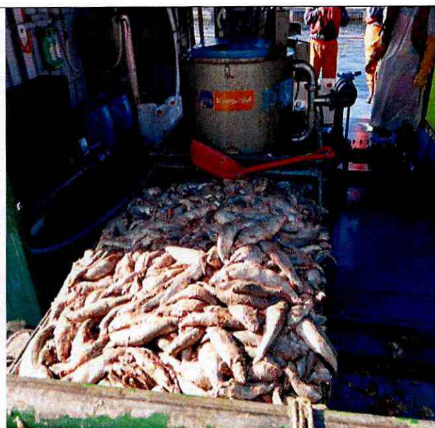
Imagen N°6: Mortalidad acopiada, en los maxisacos y en los pontones de ensilaje se encuentra en evidente estado de descomposición.