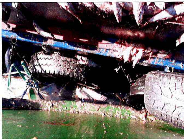
Imagen N°4: Dos sistemas de ensilaje con contenedores con mortalidad, donde uno de ellos se encontraba con su capacidad completa por lo cual se constató restos de peces alrededor de los módulos y aves alimentándose de dichos restos.