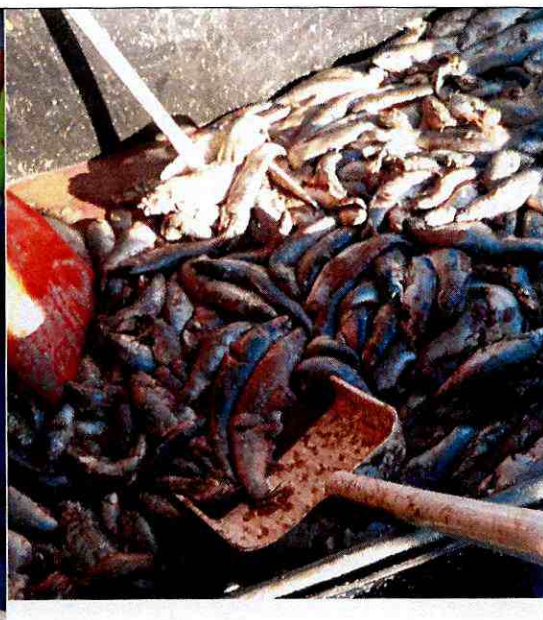
Imagen N°7: detalle de la mortalidad donde se evidencia el grado de descomposición de los peces