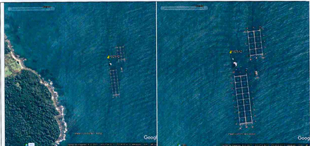
Imagen N°1: Ubicación "CES YATAC". Comuna de Quellón.

10° Según la RCA N° 816, el proyecto contempló la ampliación de área de 5,04 a 50,79 há y consecuentemente el aumento de biomasa del Proyecto Técnico Original de 3.816 a 9.887 toneladas de salmónidos.