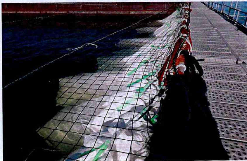
Imagen N°3: Maxisacos amarrados a las barandas de las jaulas, las cuales presentan filtración de percolados, que la cantidad de maxisacos

16° Las siguientes fotografías corresponden a las actividades detalladas anteriormente: