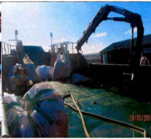
Imagen N°5: Presencia de la Barcaza Don Baldo I (CA 4478) amarrada a módulos del ensilaje y con 4 maxisacos con mortalidad en su cubierta, filtrando además líquidos percolados desde estos, sin implementarse medidas de contención tendientes a evitar la dispersión de estos al medio ambiente