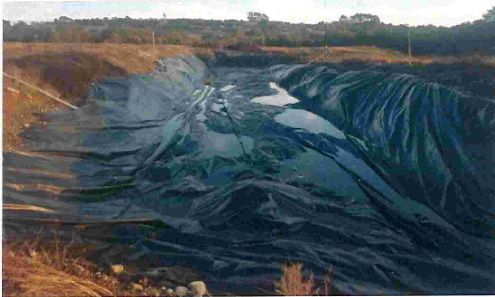
Imagen N°2: Zanja activa N°34