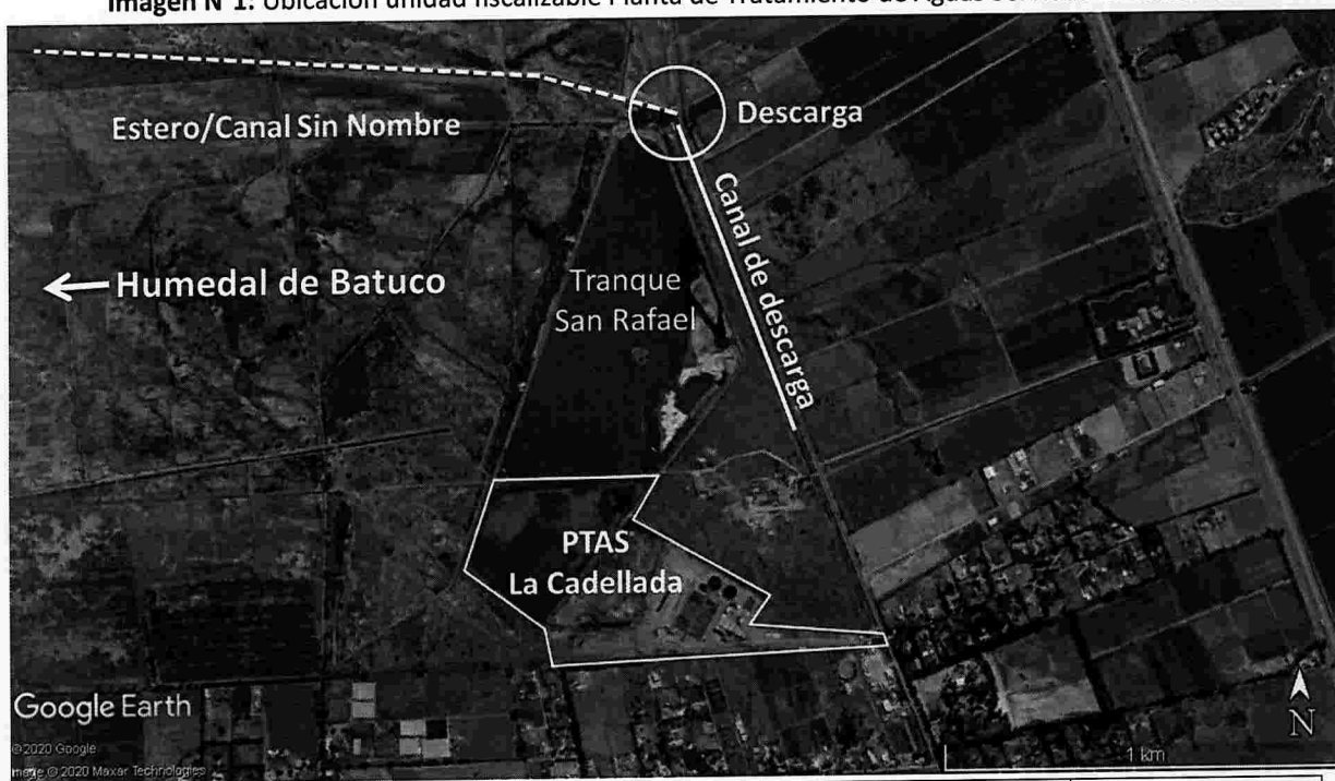
Imagen N°1: Ubicación unidad fiscalizable Planta de Tratamiento de Aguas Servidas La Cadellada