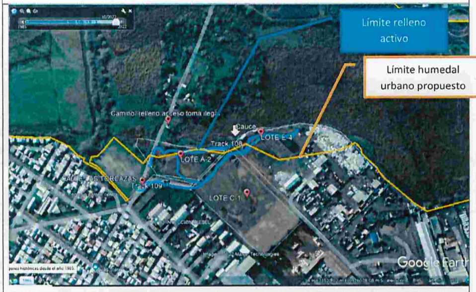
Figura 2. Recorrido de inspección ambiental de fecha 07-10-2022. La polilínea de color naranja corresponde al límite del humedal urbano propuesto, que coincide con el límite del Sitio Prioritario para este sector.