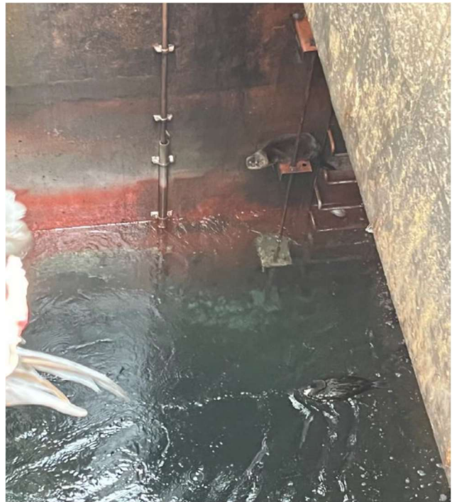
Izquierda: cuerpos de cormoranes siendo llevados en carretillas luego de retiro del pozo donde fueron encontrados.