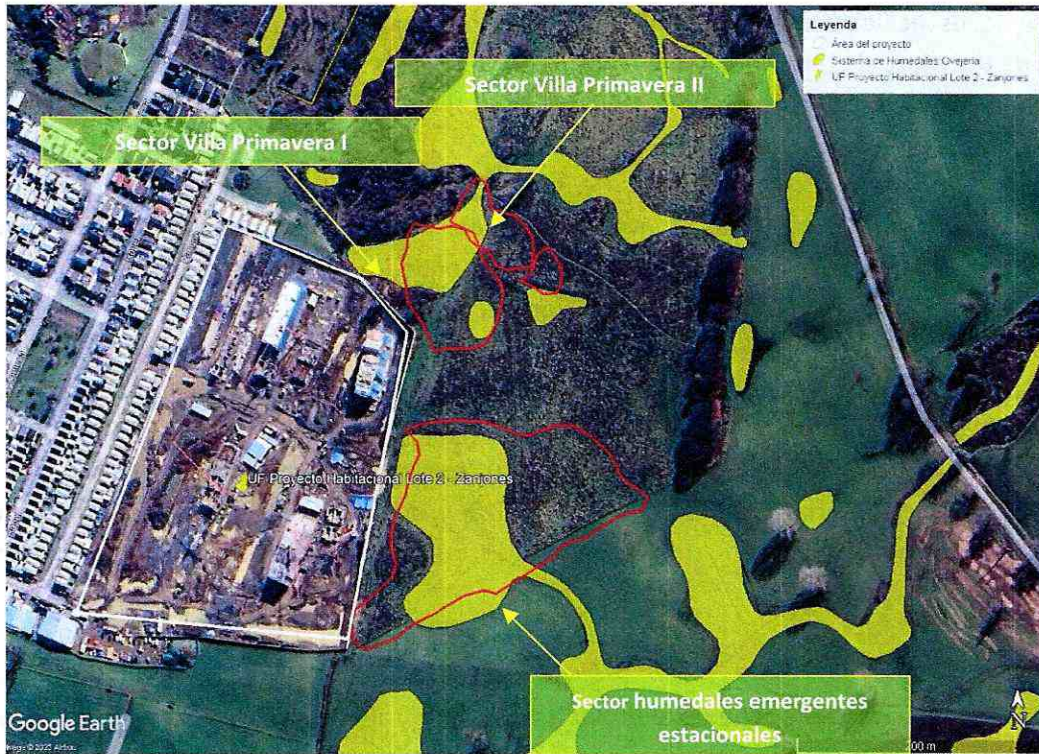
Imagen N°1: Detalle de los polígonos en amarillo del Humedal Ovejería y polígonos rojos detalle de la intervención producto de la acumulación de material terrígeno.

12° Cabe señalar que el titular no declaró el inicio de la etapa de construcción del proyecto en el Sistema de Resoluciones de Calificación Ambiental de esta SMA, por lo que no se cuenta con el dato de la fecha de inicio de actividades del proyecto. La “Imagen N°2” de la presente resolución da cuenta que los sectores de Villa Primavera I, Villa Primavera II y sector humedales emergentes estacionales, no contaban con intervención ni con cobertura de material terrígeno el 20 de noviembre de 2022, por lo que el titular habría intervenido el humedal con posterioridad a su declaración como humedal urbano.