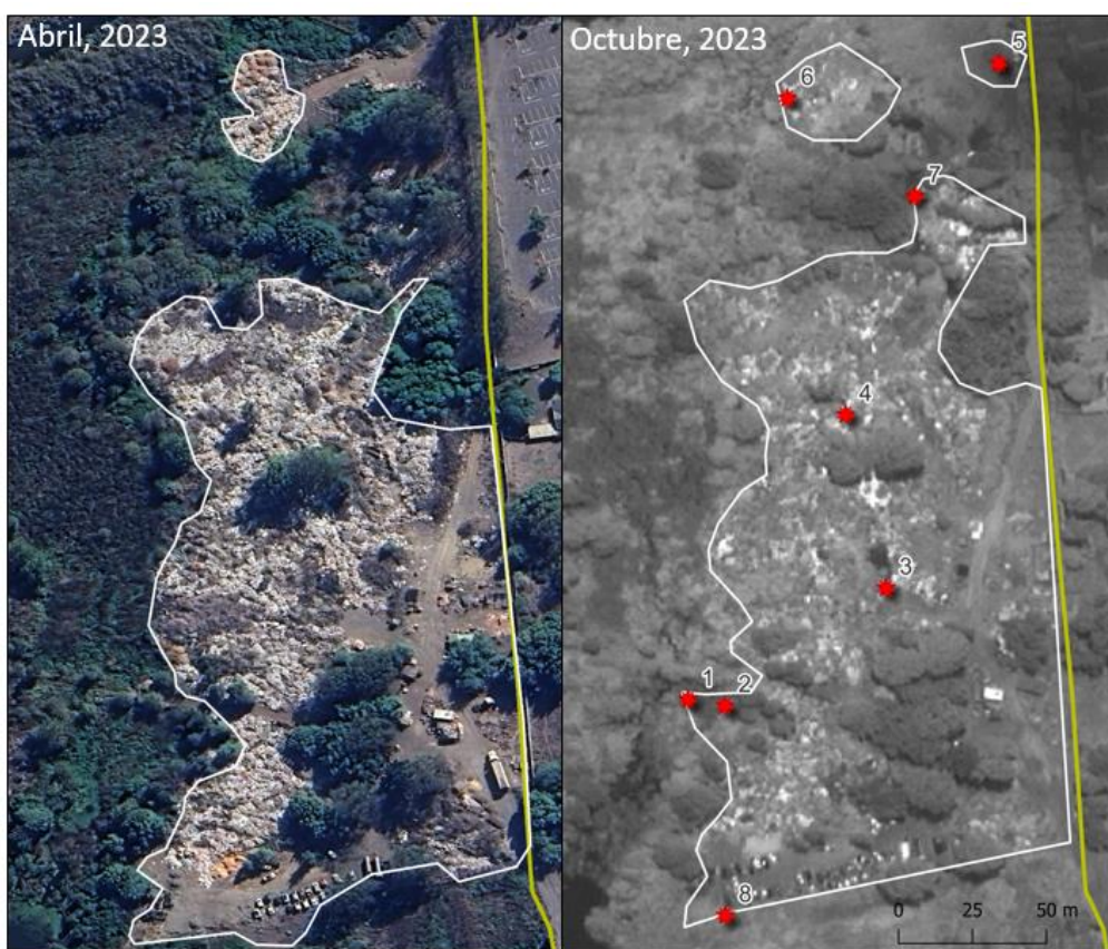
Figura N°3: Incremento de la superficie del vertedero