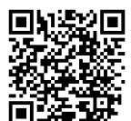
Fuente: Fiscalización SMA 24.06.2024