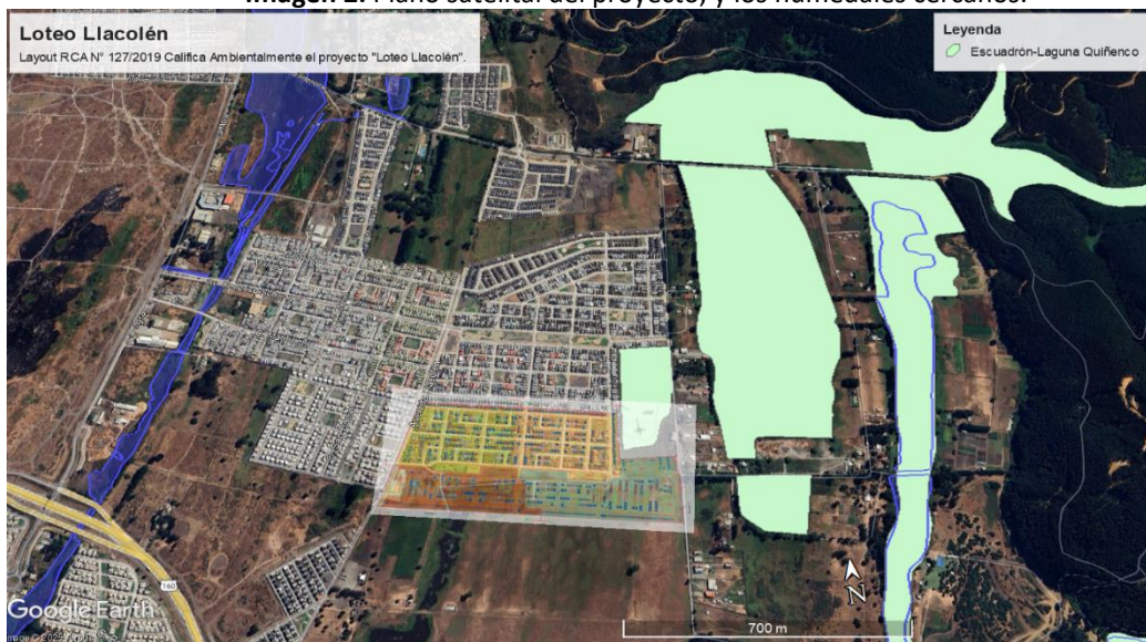
Imagen 2: Plano satelital del proyecto, y los humedales cercanos.