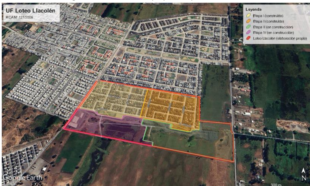
Imagen 1: Plano satelital del proyecto, separando sus 4 fases.