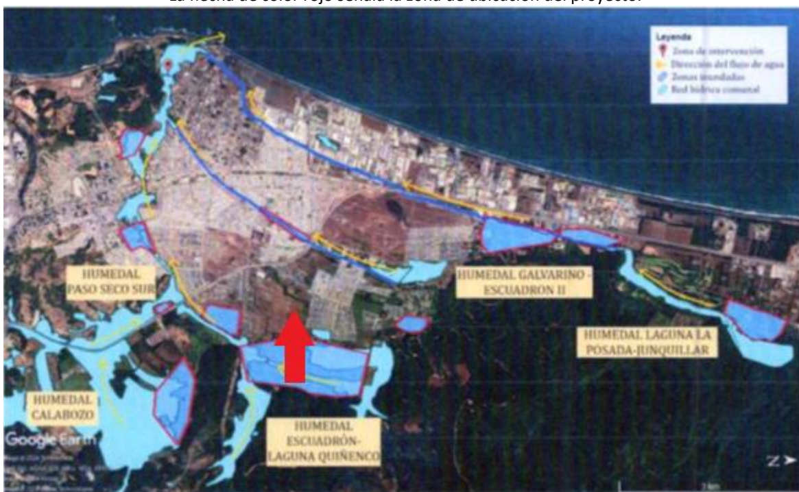
Imagen 3: Red hídrica comunal, con flechas de color amarillo indicando el flujo de las aguas, que concluyen, previo a desembocar en el mar, en el “ Humedal Urbano Boca Maule ”, marcado con un “ pin ” de color rojo. La flecha de color rojo señala la zona de ubicación del proyecto.

Fuente: Elaborado por la Municipalidad de Coronel, acompañado mediante Ordinario Alcaldicio N°1132, de fecha 10 de julio de 2024. Flecha de color rojo agregada para indicar la ubicación del proyecto.