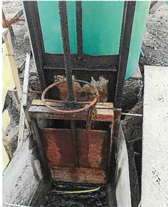
Fotografía 3. Compuertas Tranque San Rafael (a cerrar)

Para lograr lo anteriormente expuesto, se solicita autorizar el cierre de las actuales compuertas de salida del Tranque San Rafael (fotografía 3) con el fin priorizar la mantención del espejo de agua del Tranque y resguardar la biodiversidad de avifauna presente, junto con dar cumplimiento con lo establecido en torno a la medida de compensación.