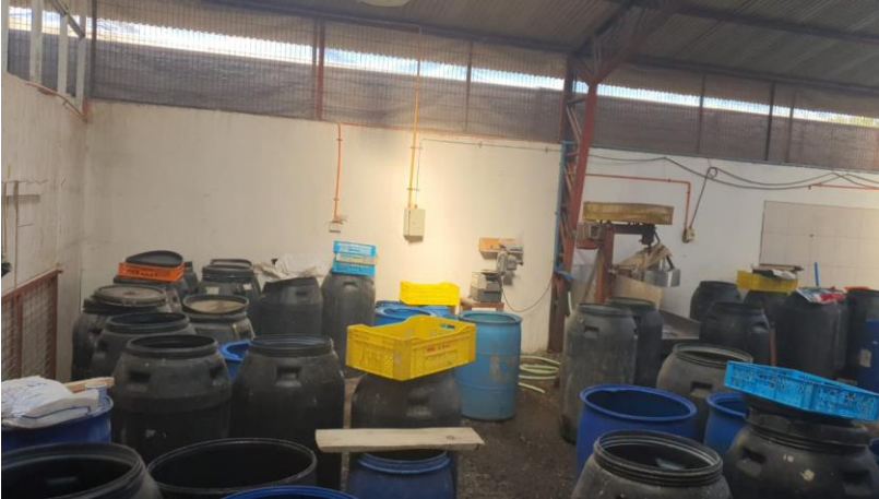
Imagen 2. Bidones con producto terminado.