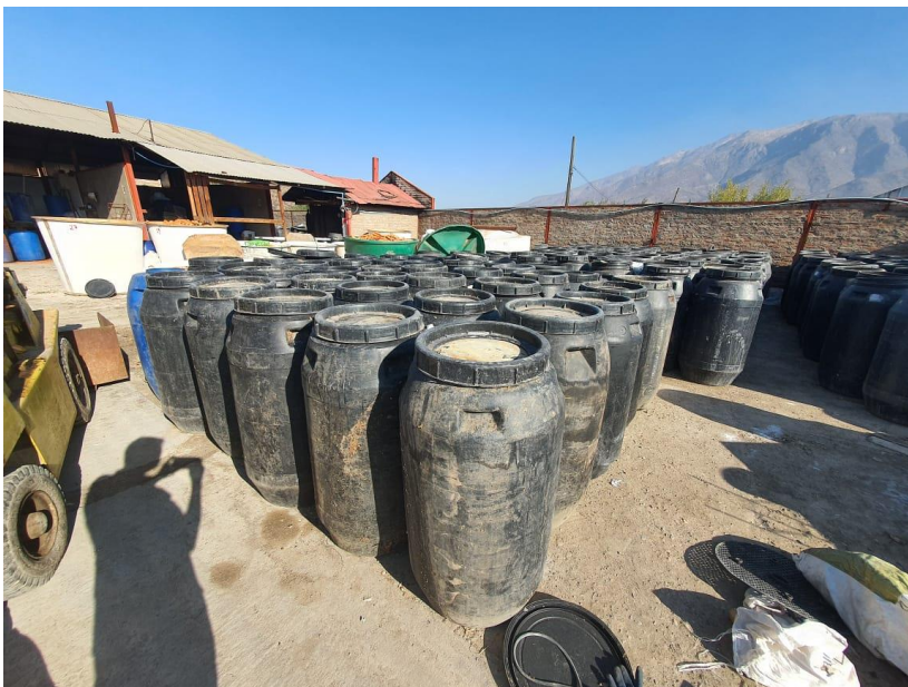
Imagen 4. Bidones en patio con materias primas almacenadas.