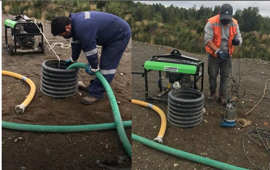
Fotografía N°3: Retiro de Lixiviados de Chimenea de lixiviados sobrecelda- Zanja Sanitaria N°1, por Empresa Aconser. Tomada: Sábado 03 de Julio del 2021.