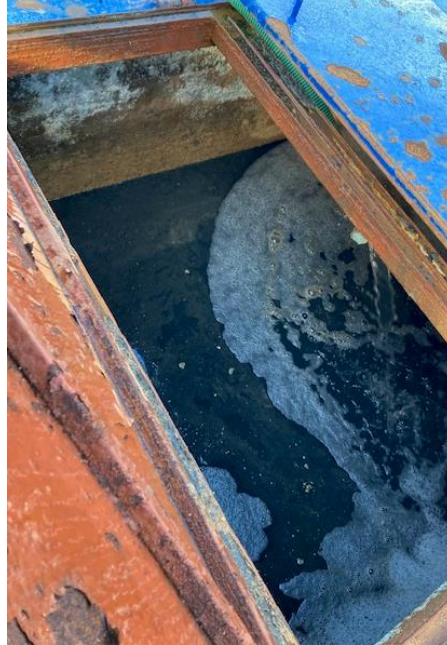
Fotografía N°5: Retiro de Lixiviados a batea de acumulación, por personal Municipal. Tomada: Martes 06 de Julio del 2021.