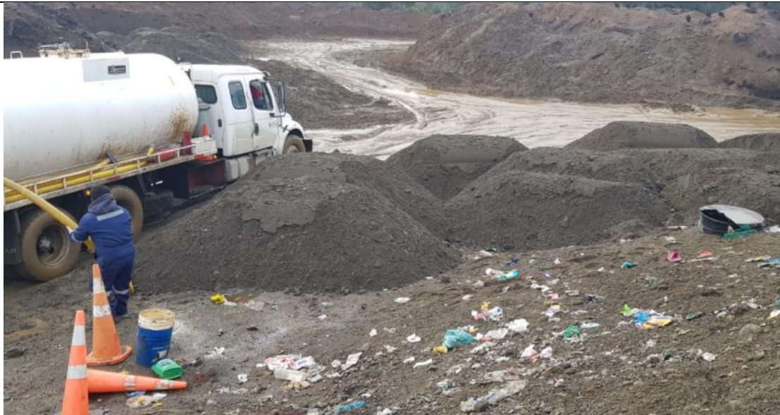
Fotografía N°6: Retiro de Lixiviados de cámaras de inspección de sobrecelda- Adecuación Zanja Sanitaria N°1, por Empresa Aconser. Tomada: Jueves 08 de Julio del 2021.