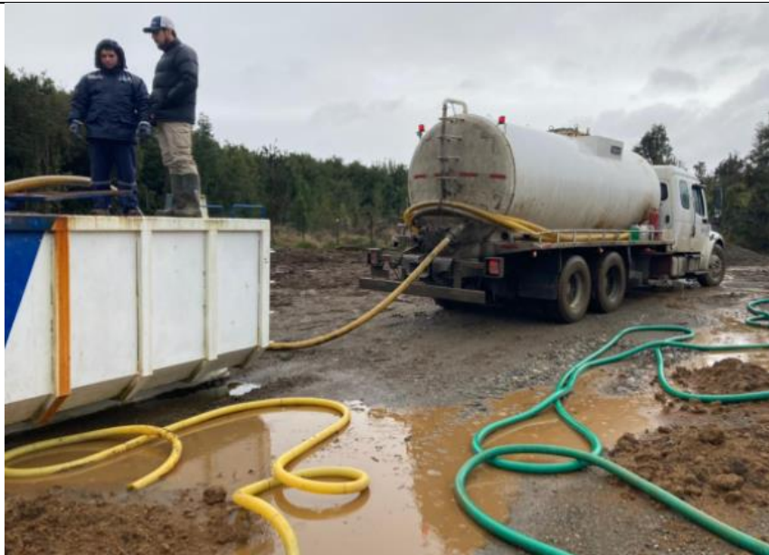
Fotografía N°10: Retiro de Lixiviados desde batea de acumulación, por Empresa Aconser. Tomada: Jueves 15 de Julio del 2021.