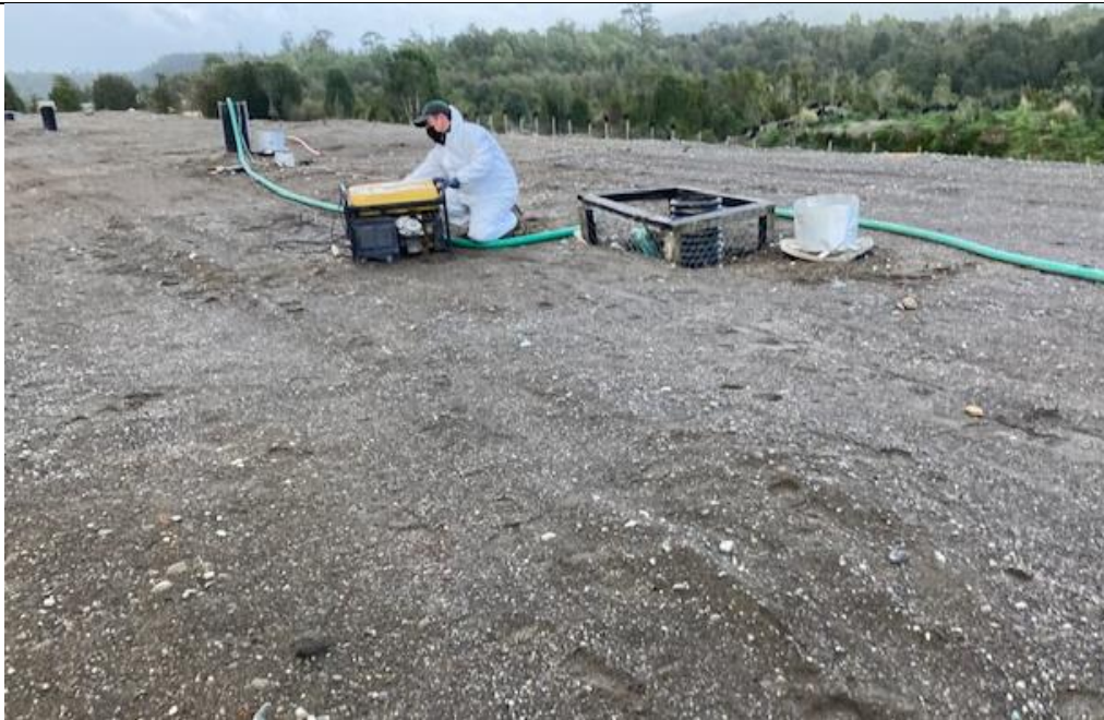
Fotografía N°4: Retiro de Lixiviados de Chimeneas y pozo de acumulación a batea de acumulación, por Empresa Aconser. Tomada: Lunes 06 de Julio del 2021.