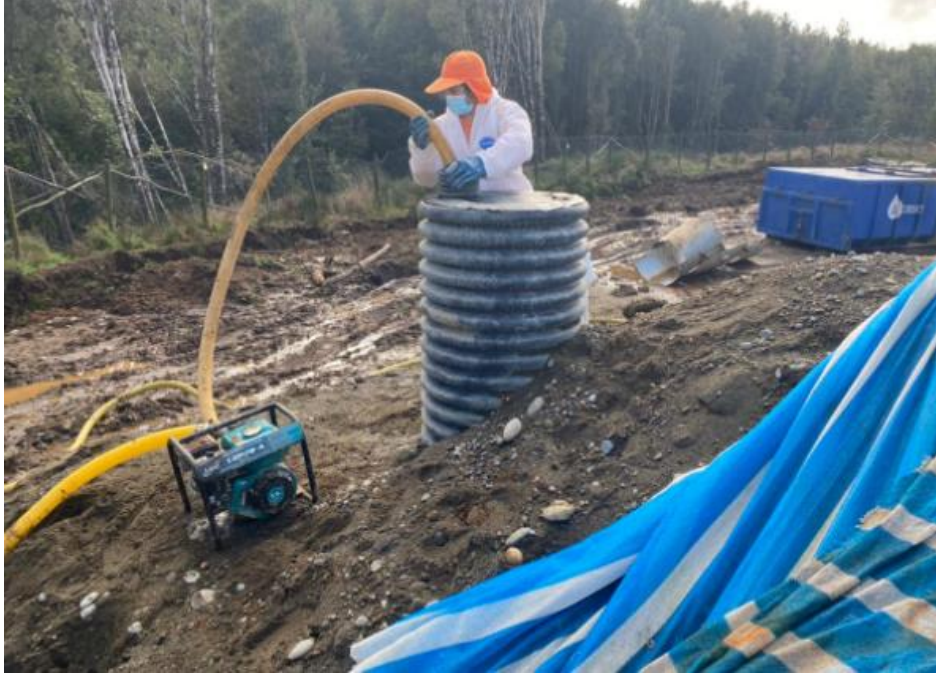
Fotografía N°9: Retiro de Lixiviados de cámaras de inspección de sobrecelda zona norte- Zanja Sanitaria N°1, por Empresa Aconser. Tomada: Miércoles 14 de Julio del 2021.