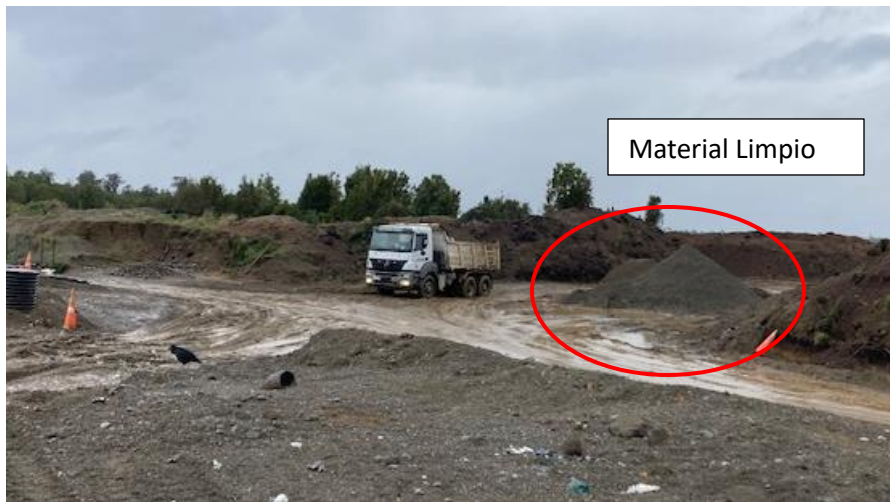
Fotografía N°12: Acopio Material limpio para remplazo de material y así dar cumplimiento a medida provisional.