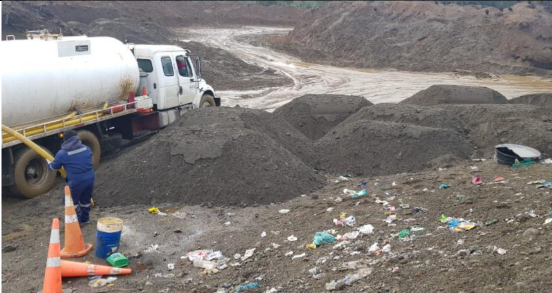
Fotografía N°5: Retiro de Lixiviados de cámaras de inspección de sobrecelda- Adecuación Zanja Sanitaria N°1, por Empresa Aconser. Tomada: Jueves 08 de Julio del 2021.