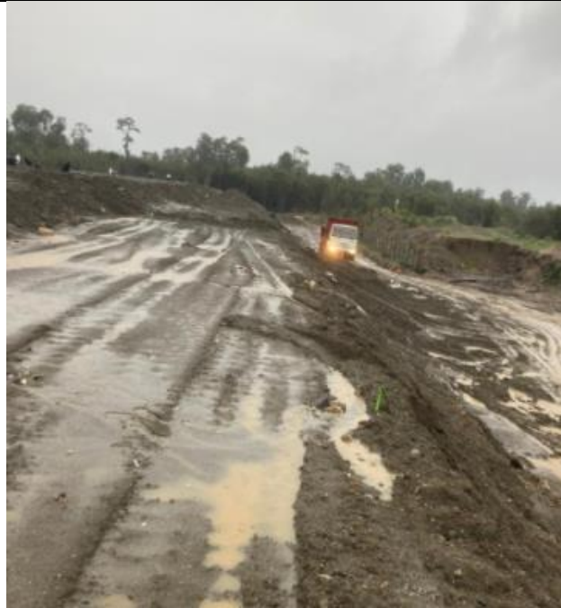
Fotografía N°11: Camión tolva llevando material limpio a zona de pretil de contención.