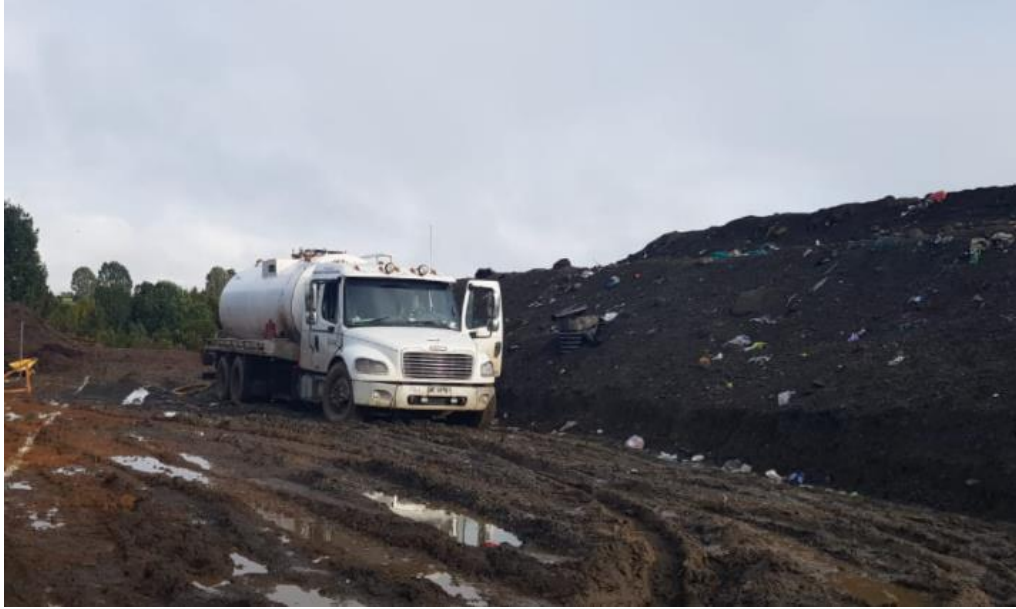
Fotografía N°1: Retiro de Lixiviados por Empresa Aconser. Tomada: Sábado 03 de Julio del 2021.

Se realiza Extracción de lixiviados de manera inmediata una vez salida la Res. Exenta N°1526-