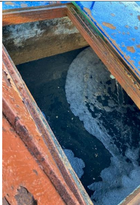
Fotografía N°4: Retiro de Lixiviados a batea de acumulación, por personal Municipal.