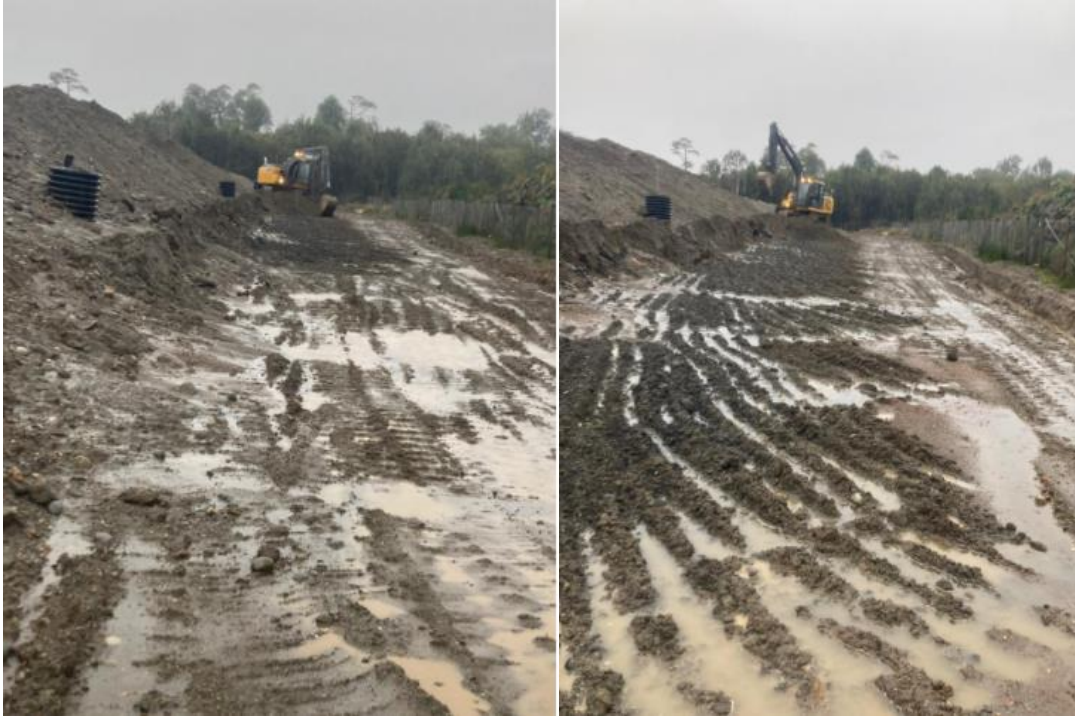
Fotografía N°9: Retiro de Material Pretil de contención- Zanja Sanitaria N°1, por Empresa Crecer Tomada: jueves 08 de Julio del 2021.