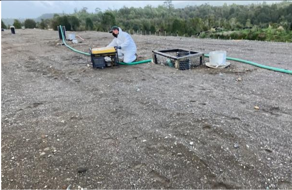
Fotografía N°3: Retiro de Lixiviados a batea de acumulación, por Empresa Aconser.