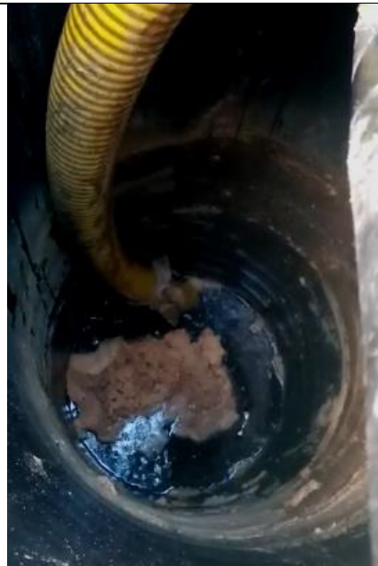
Fotografía N°6: Retiro de Lixiviados de cámaras de inspección de sobrecelda- Zanja Sanitaria N°1, por Empresa Aconser. Tomada: Viernes 09 de Julio del 2021.