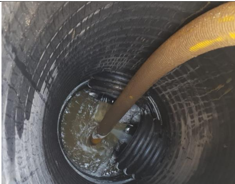
Fotografía N°2: Retiro de Lixiviados de cámaras de inspección de sobrecelda- Adecuación Zanja Sanitaria N°1, por Empresa Aconser. Tomada: Sábado 03 de Julio del 2021.