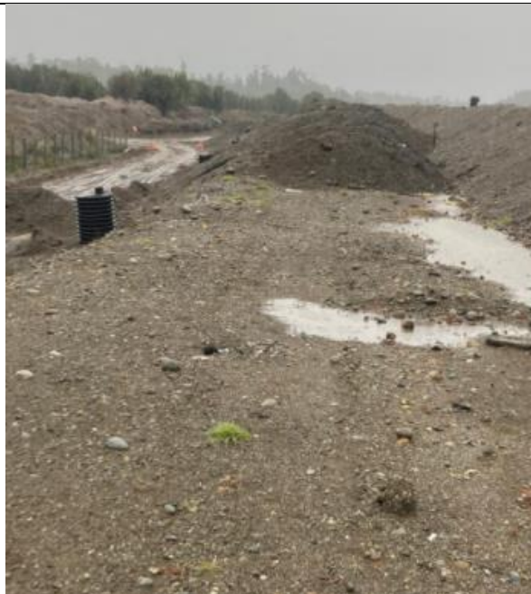
Fotografía N°10: Material contaminado se acopia al interior de la zanja. Tomada: Jueves 08 de Julio del 2021.