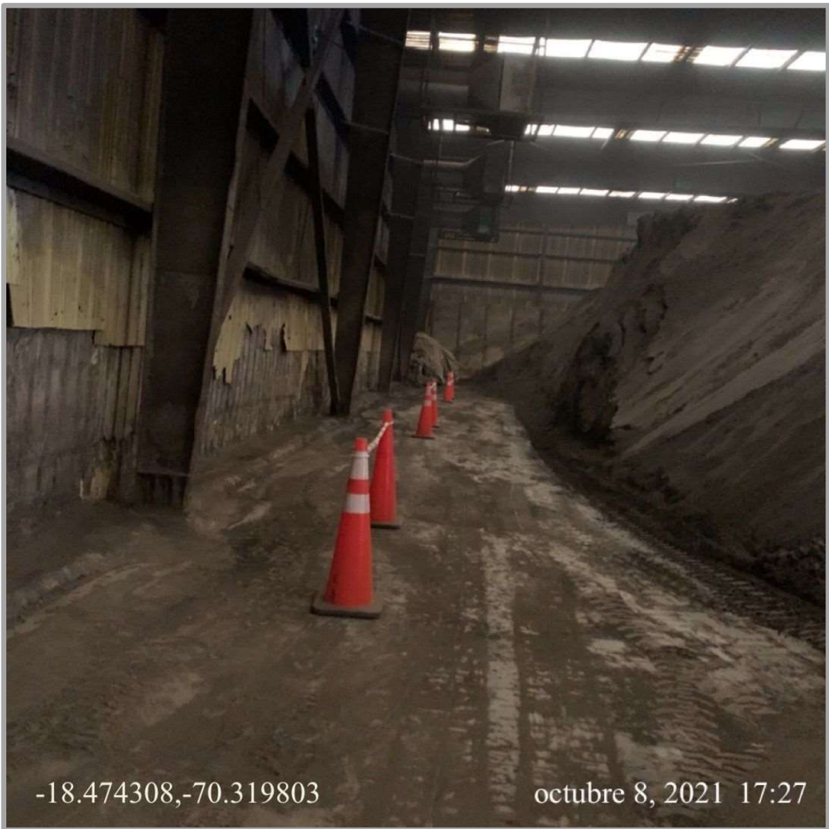
Fotografía N° 3