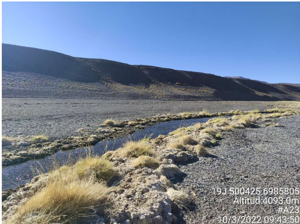
Fotografía 3. Registro 3 de campaña de terreno del 10 de marzo de 2022.