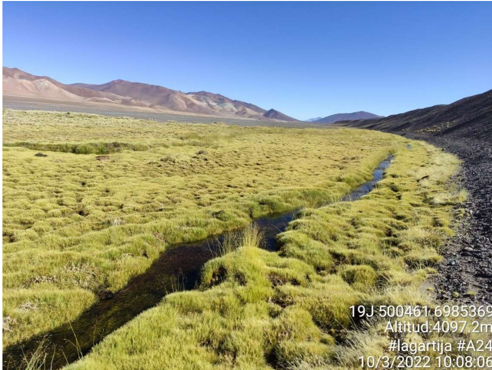
Fotografía 1, Registro 1 de campaña de terreno del 10 de marzo de 2022.

En las siguientes fotografías, se adjunta registros de los lugares caracterizados: