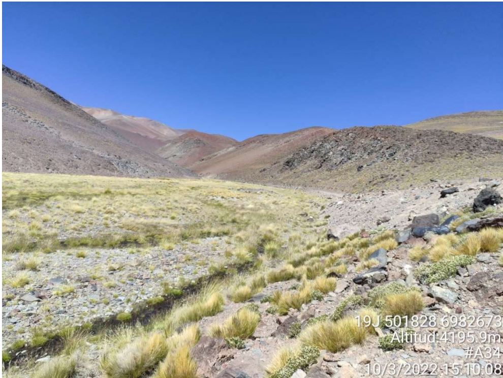
Fotografía 2. Registro 2 de campaña de terreno del 10 de marzo de 2022.