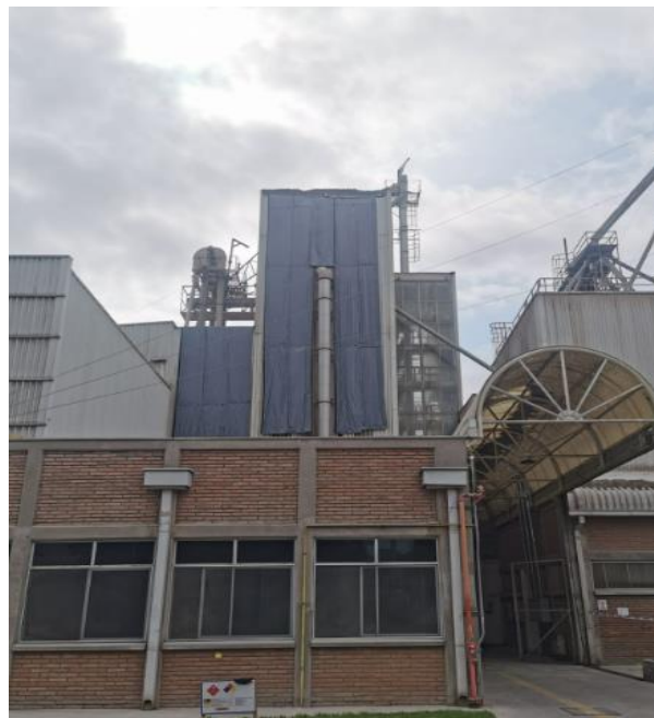
Imagen 1: Implementación de BAF en sector de ventiladores.

Se hace presente que siguiendo las recomendaciones del mencionado Informe de Decibel (recepionado por mi representada con fecha 24 de noviembre de 2022), Agrícola Super Limitada implementó la Barrera Acústica Flexible (BAF) para el sector de los ventiladores tal como se puede apreciar en la Imagen 1 siguiente de esta presentación: