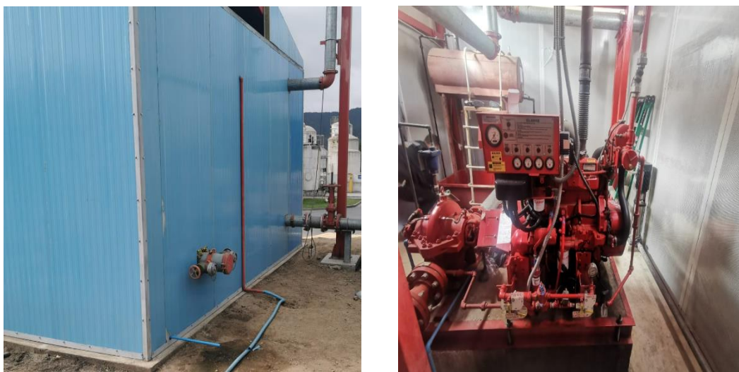
Imagen 2. Estado actual de la implementación del encierro acústico de la bomba de incendio

Por otra parte, se hace presente que, a la fecha de esta presentación, se han reemplazado los siguientes equipos: (i) Ventiladores (línea 1 y 2); (ii) Enfriadora línea 2 y (iii) Ciclón línea 2. Para dar cuenta de lo anterior se adjunta en Anexo 1 de esta presentación registro fotográfico fechado y georreferenciado de los mencionados equipos.