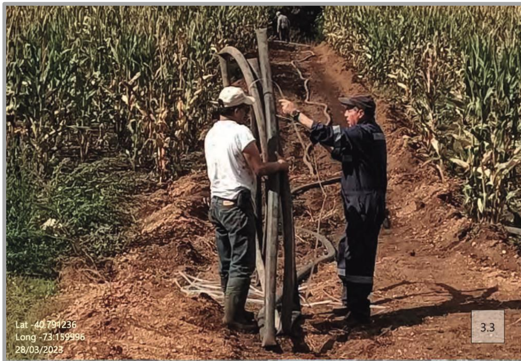
Algunas fotografías del registro acompañado en el PdC