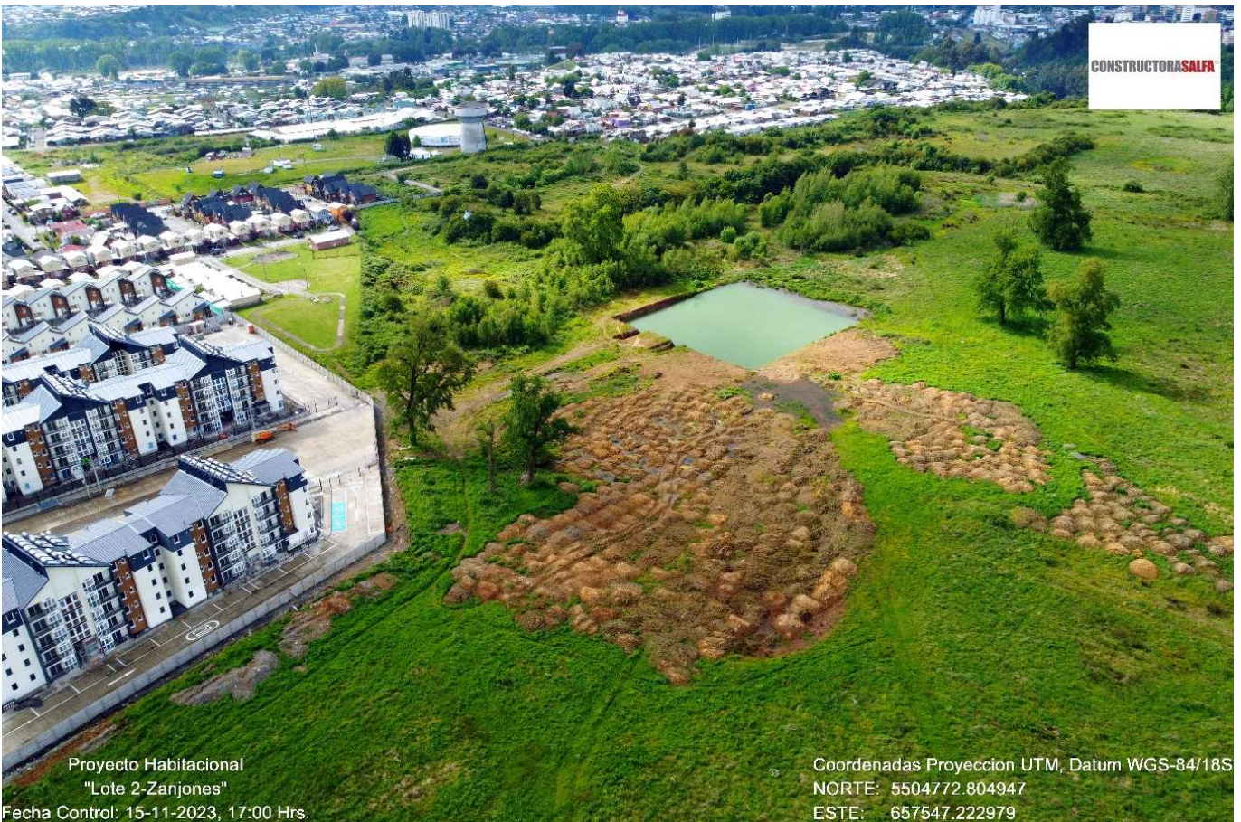
Proyecto Habitacional "Lote 2-Zanjones" Fecha Control: 15-11-2023, 17:00 Hrs.

Coordenadas Proyeccion UTM, Datum WGS-84/18S NORTE: 5504728.398042 ESTE: 657438.147878