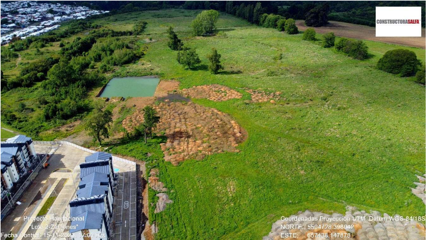
Proyecto Habitacional "Lote 2-Zanjones" Fecha Control: 15-11-2022, 17:00 Hrs.

Coordenadas Proyeccion UTM, Datum WGS-84/18S NORTE: 5504728.398042 ESTE: 657438.147878