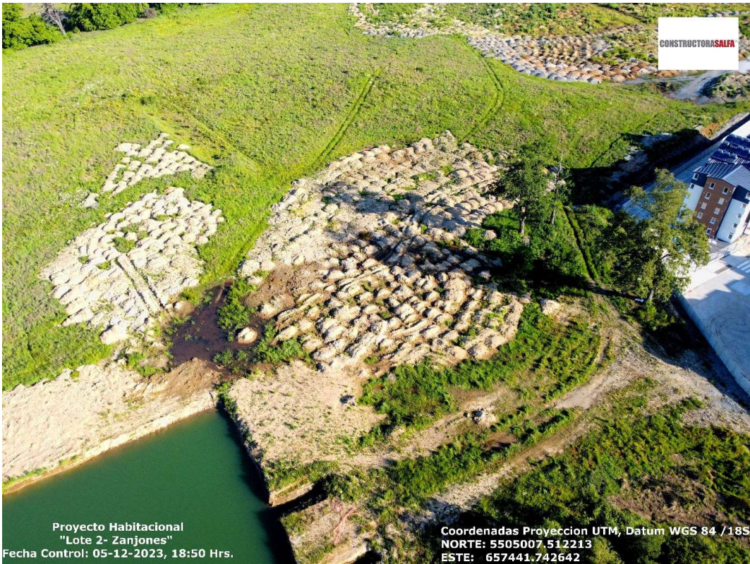
Proyecto Habitacional "Lote 2- Zanjones" Fecha Control: 05-12-2023, 18:50 Hrs.

Coordenadas Proyeccion UTM, Datum WGS 84 /18S NORTE: 5505092.187694 ESTE: 657567.599903