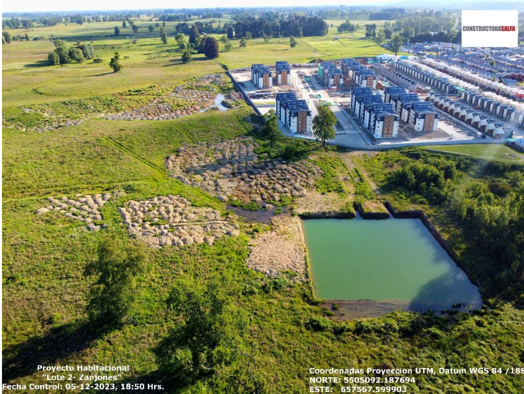
Proyecto Habitacional "Lote 2- Zanjones" Fecha Control: 05-12-2023, 18:50 Hrs.

Coordenadas Proyeccion UTM, Datum WGS 84 /18S NORTE: 5505092.187694 ESTE: 657567.599903