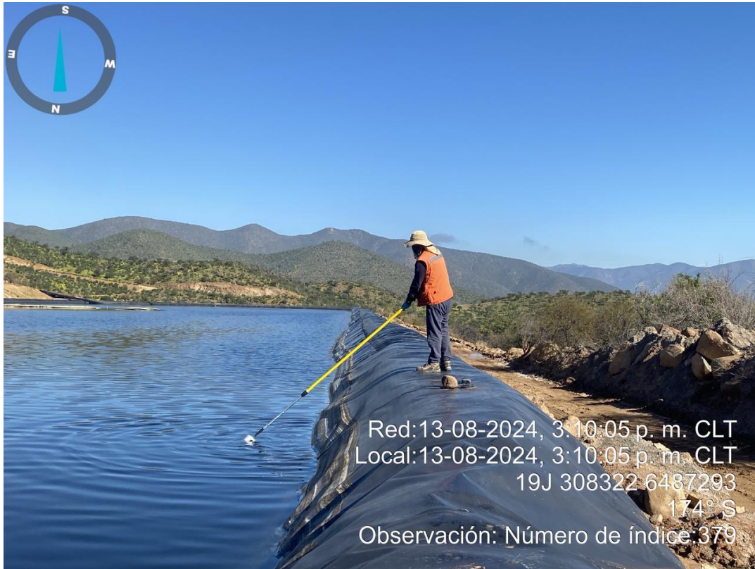
Figura N°7: Muestra Solución