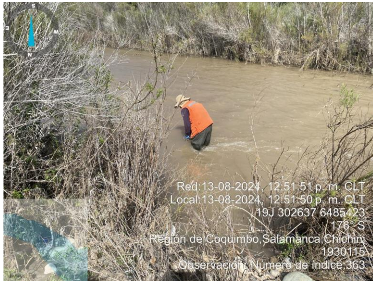
Figura N°5: Muestra Choapa 1