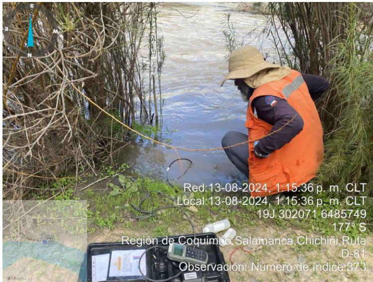
Figura N°6: Muestra Choapa 2