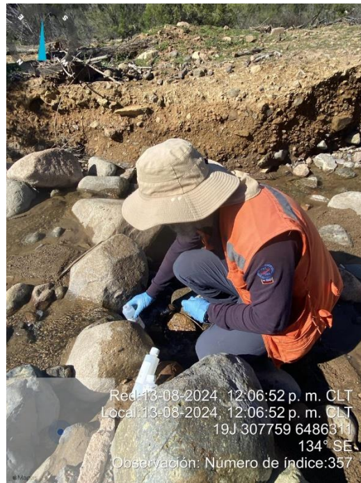
Figura N°2: Muestra Agua Superficial 2