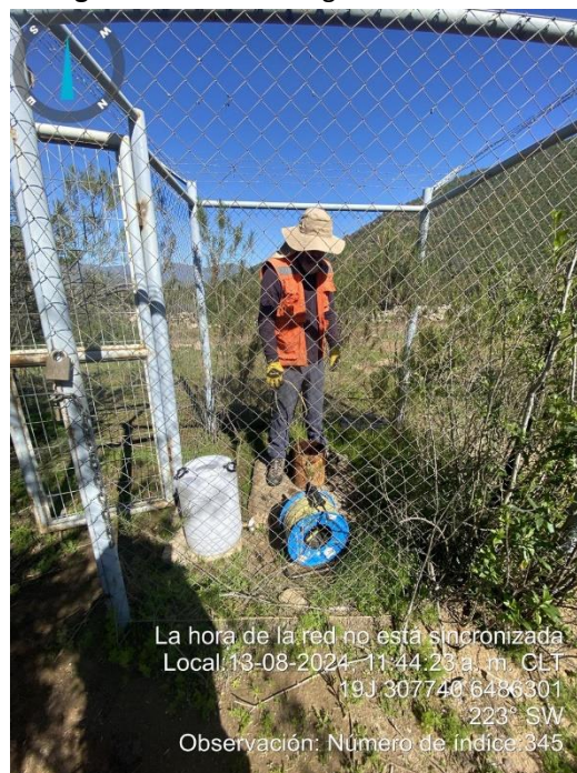
Figura N°4: Muestra Agua Subterránea 2