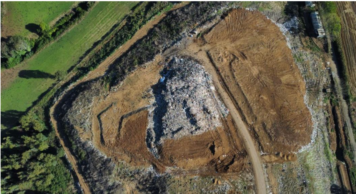
Fotografías (3) Sobrevuelo Drone 17 de marzo de 2025