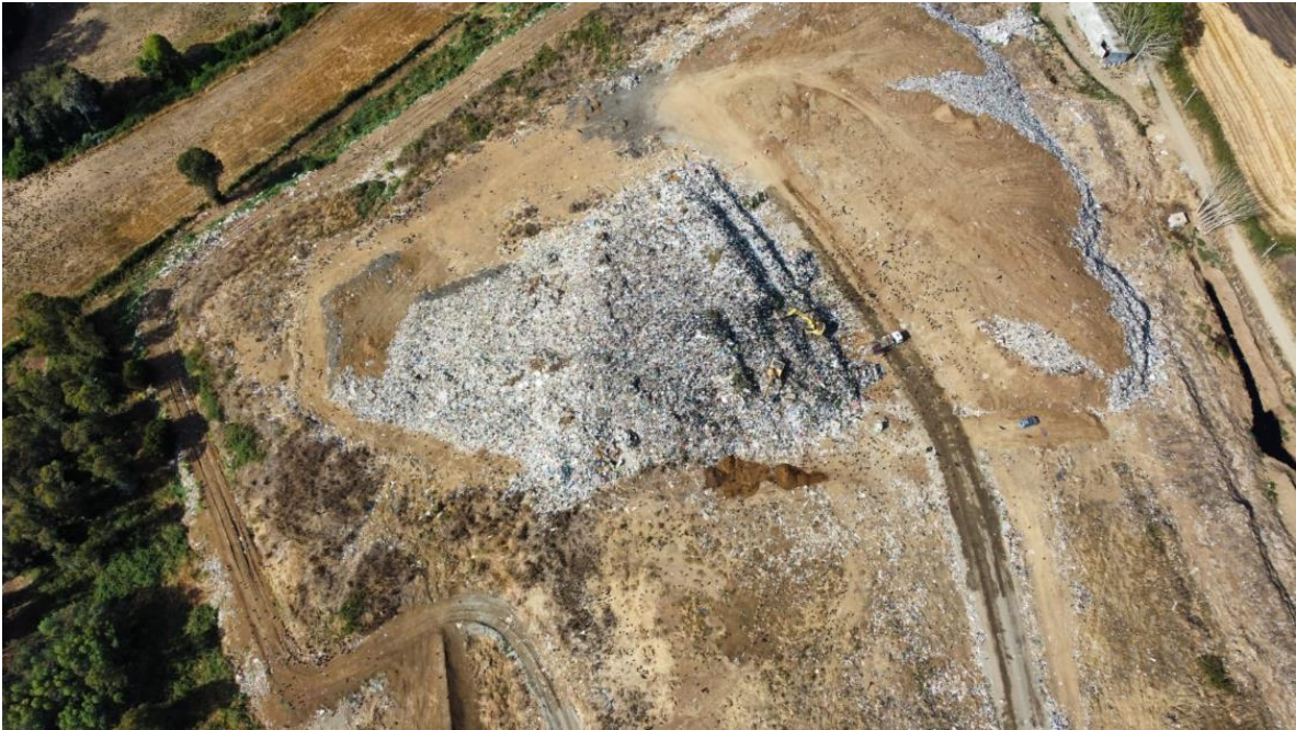
Fotografías (3) Sobrevuelo Drone 03 de marzo de 2025