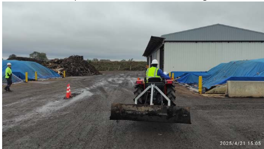
Fotografías 5: Tractor barredor

Además, se adquirió un nuevo tractor, que solo está enfocado en las labores de limpieza de la planta, lo que ha permitido “barrer” de manera rápida y eficiente cualquier resto de material que caen ha las calles. Ver fotografía 5