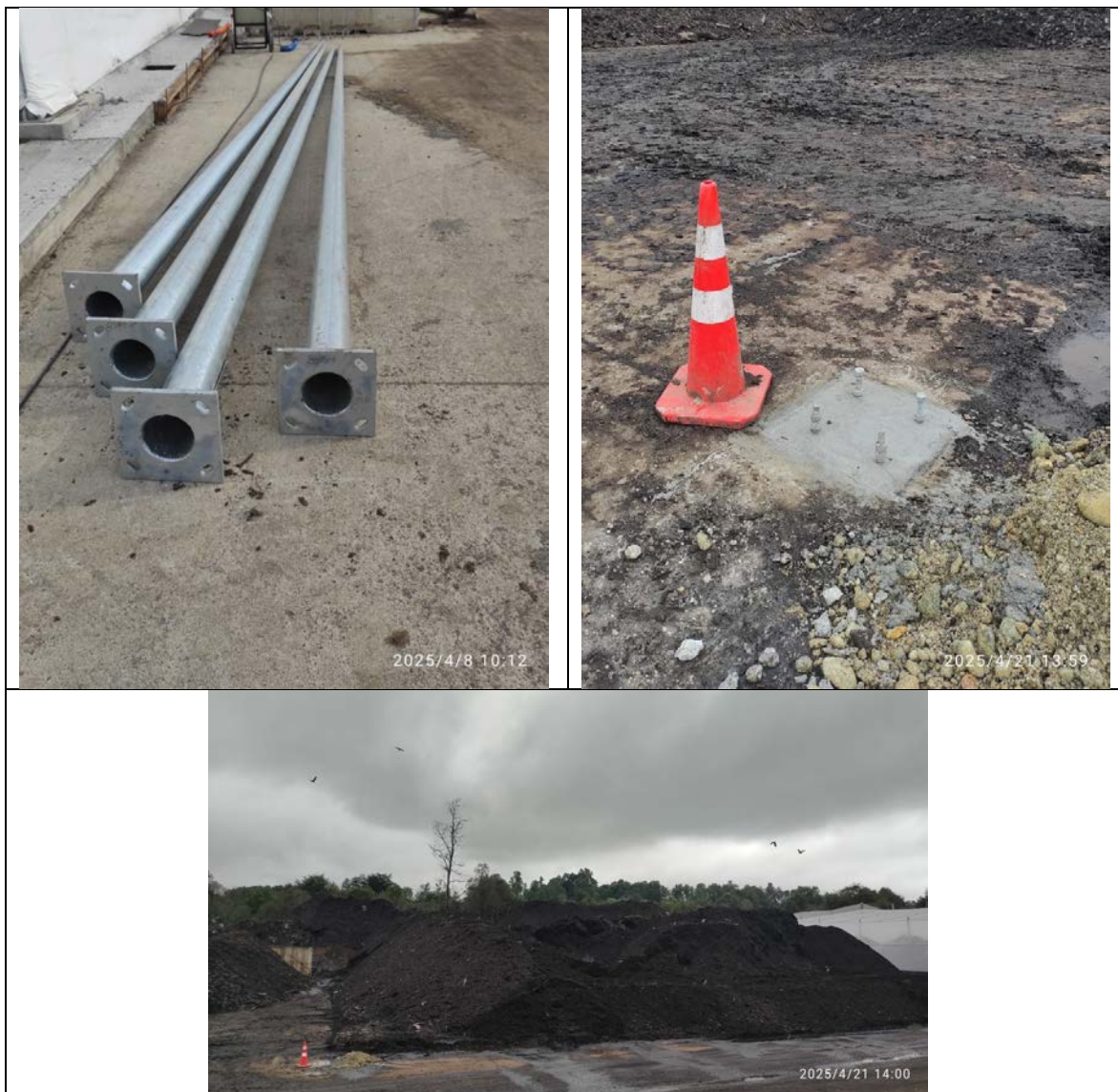
Fotografías 3: Línea 140 metros. Actualmente en construcción

un sistema de roldanas que permita bajar la línea para ser limpiada o reparada. Ésta línea como está en la Carta Gantt debe estar en operación la semana del 28 de abril al 4 de mayo. Pero presenta avances como pueden identificarse claramente en las siguientes fotografías: