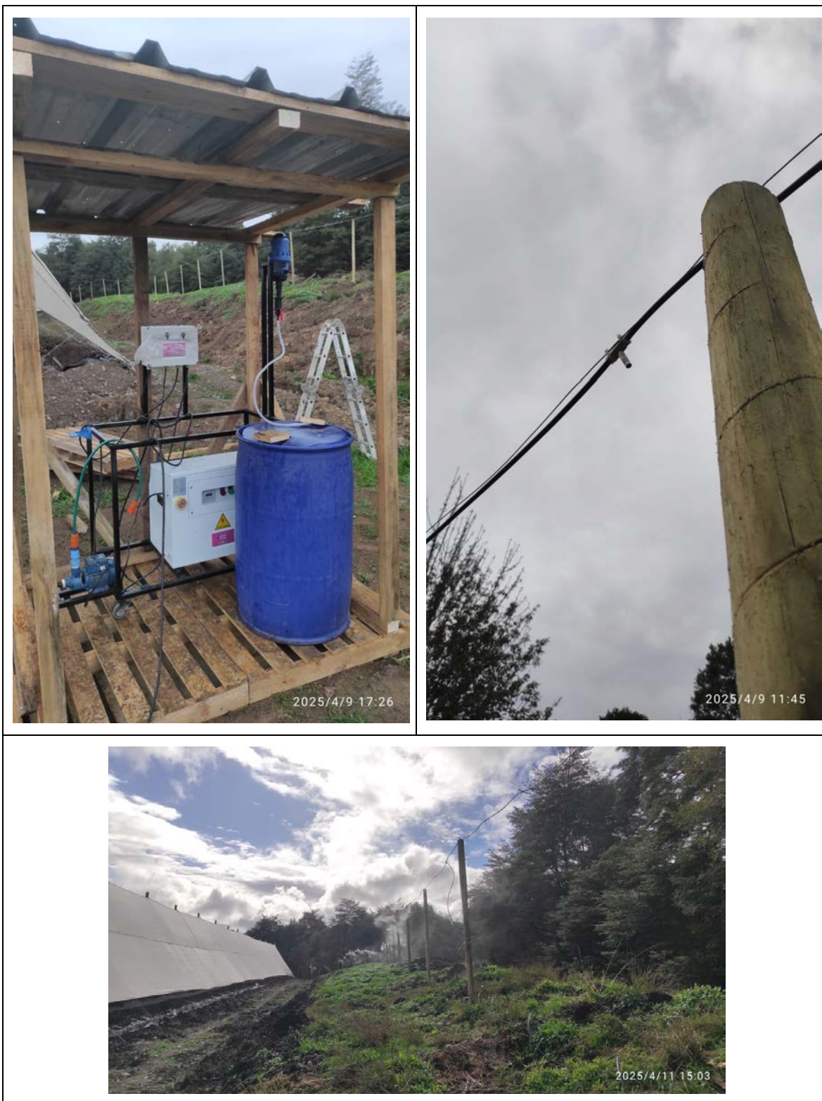
Fotografías 2: Línea 200 metros

La segunda línea, de aproximadamente 140 metros, por tener una complejidad mayor al tener una altura superior a los 6 metros debe ser montada en pollos apernados, con