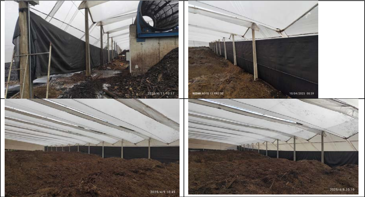
Fotografías 1: Mejoras en Galpón zona maduración

Logramos adelantar las mejoras alrededor de dos semanas, los trabajos comenzaron la semana 7 de abril, y se proyecta que terminen a mediados de mayo. A continuación, se muestran las fotografías de los avances: