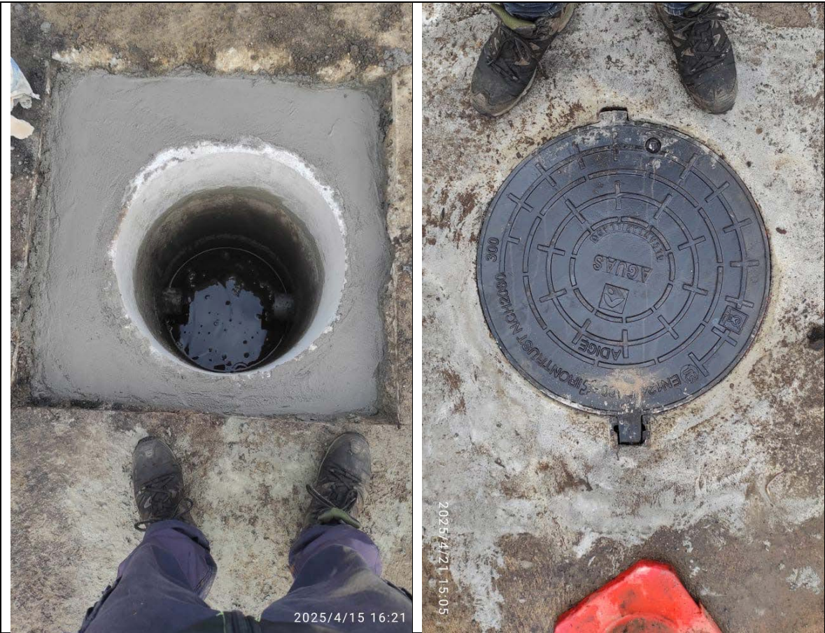
Fotografías 4: Mejora de cámaras

Parte fundamental de las 4 primeras semanas de ejecución de las MUT, y sobre todo en este capítulo, ha estado enfocado ha realizar mejoras operacionales de la planta, para ello se han realizado una serie de cambio y mejoras siendo las más relevantes: La incorporación de dos cámaras nuevas que permite una mejora sustancial en la limpieza de los sistemas de aire: