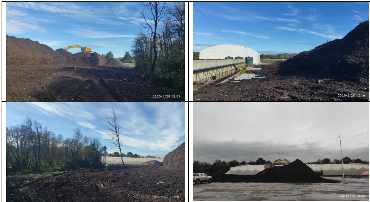
Fotografías 1: Áreas limpias, resguardo de árboles y cursos de agua (aprox. 25 m)

En relación con la medida consistente en el retiro inmediato de los acopios que se encuentran fuera del área del proyecto, se muestran algunas fotografías de cómo está quedando el terreno: