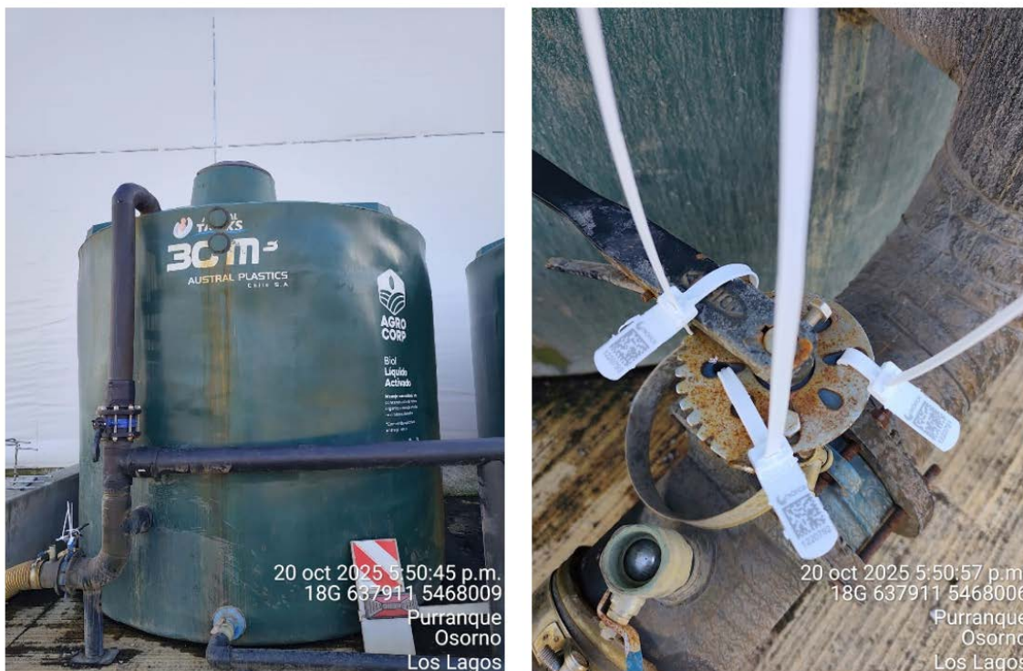
Imagen 3. Fotografía estanque de producto BIOL 20 de octubre del 2025 (Sellos 1220791, 1220792 y 1220793)

En las imágenes, se muestra fotografías tomada hoy, lunes 20 de octubre post sellado de los estanques acumuladores de residuos líquidos. Fotografías fechadas, georreferenciadas y coordenadas en UTM datum WGS 84 huso 19 (usando aplicación Timestamp Camera Enterprise ).