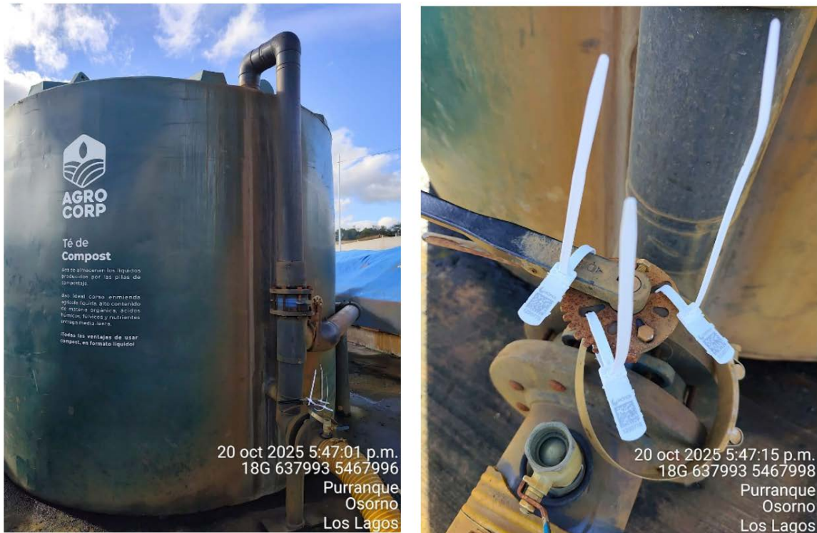
Imagen 4. Fotografía estanque Té de Compost 20 de octubre del 2025 (Sellos 11220776, 1220777 y 1220778).