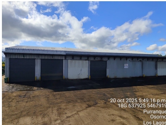
Imagen 2. Fotografía planta 20 de octubre del 2025