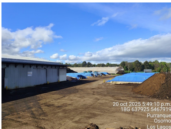
Imagen 1. Fotografía planta 20 de octubre del 2025.

En las imágenes, se muestra fotografías tomada hoy, lunes 20 de octubre a la planta en condiciones de detención de las actividades de la planta. Fotografías fechadas, georreferenciadas y coordenadas en UTM datum WGS 84 huso 19 (usando aplicación Timestamp Camera Enterprise ).