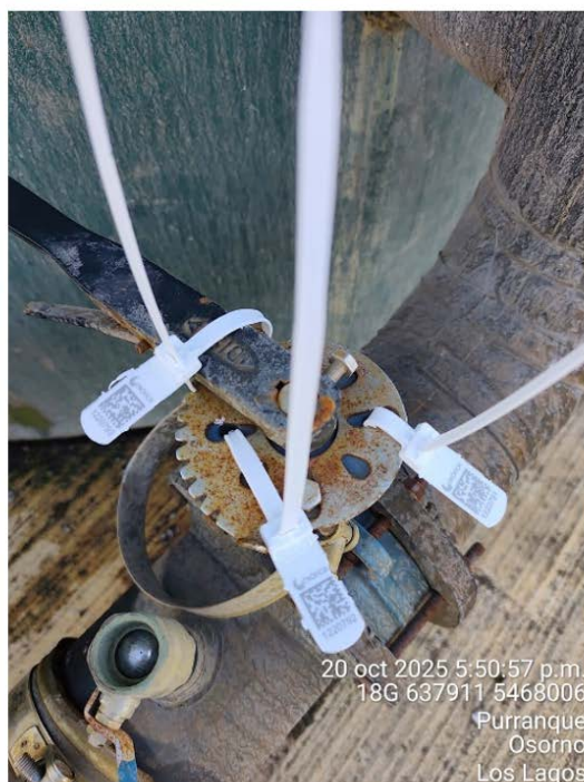
Imagen 4. Fotografía estanque de producto BIOL 20 de octubre del 2025 (Sellos 1220791, 1220792 y 1220793)