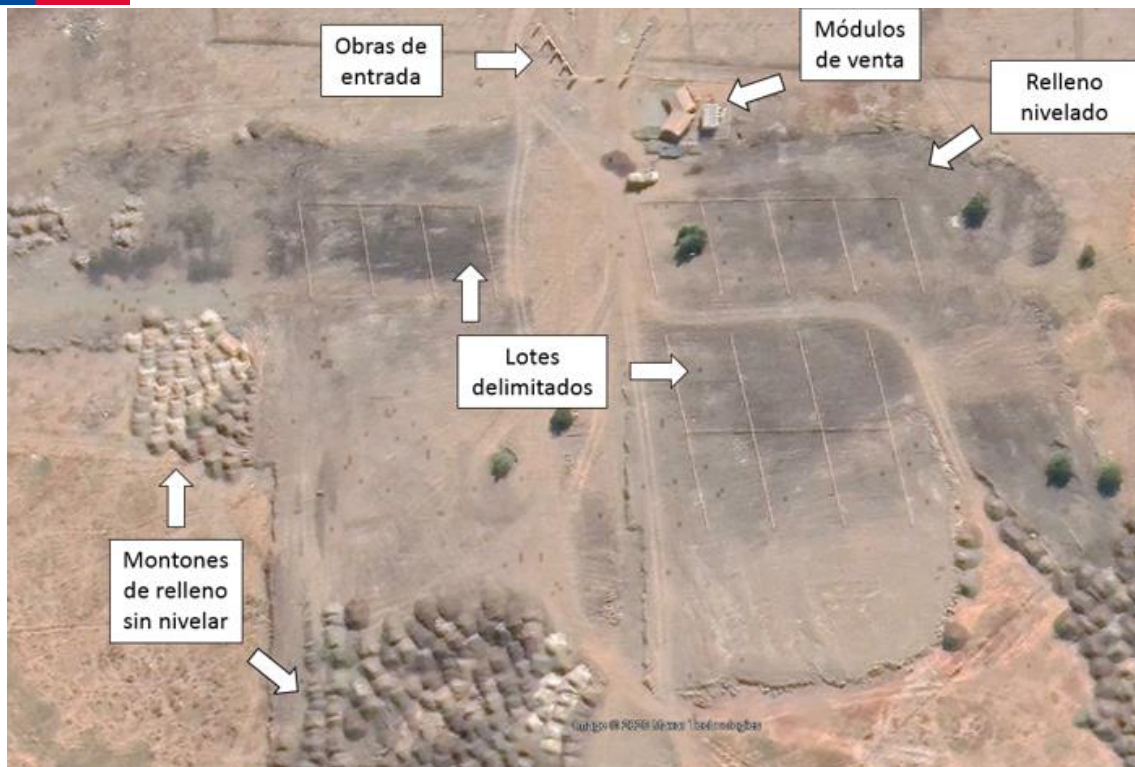
Figura 2. Descripción general de los elementos que incluye la Unidad Fiscalizable “Loteo Inversiones Lampa SpA” (Fuente: Informe de Fiscalización Ambiental DFZ-2020-2474-XIII-SRCA)

7. Cabe indicar, que la empresa fue previamente apercibida para ingresar al Sistema de Evaluación de Impacto Ambiental mediante el Resuelvo Tercero de la Res. Ex. N°1855, de 21 de septiembre de 2020, iniciado a raíz de la denuncia por elusión al Sistema de Evaluación de Impacto Ambiental (SEIA) (362-XIII-2019).