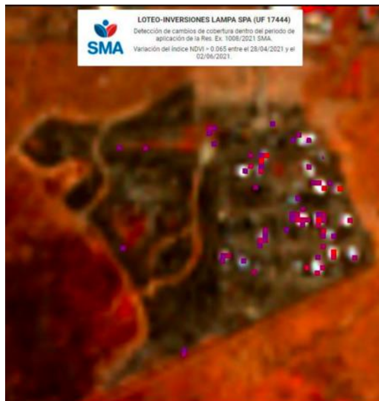
Figura N°4: Informe Técnico de 03 de junio de 2021 Equipo de Geoinformación – División de Seguimiento e Información Ambiental SMA. Detección de pérdidas de vegetación mediante variación del índice NDVI y levantamiento topográfico de perímetro

39. Mediante estos análisis, se pudo comprobar en abril de 2021 la pérdida de al menos, 6.600 m 2 de cobertura vegetal entre el 09 de marzo y el 03 de abril de 2021 producto de las actividades de relleno sobre el humedal. Asimismo, según análisis realizado en mayo de 2021, se pudo identificar la pérdida de, al menos, 7.400 m 2 de cobertura vegetal entre el 13 y el 28 de abril de 2021 producto de las actividades de relleno sobre el humedal. A su vez, según los informes técnicos de junio y julio, señalaron que, del análisis comparado entre las imágenes satelitales del 28 de abril, 2 y 22 de junio, se concluyó la ausencia de procesos de expansión en superficie de la actividad analizada sobre las zonas no intervenidas del Humedal de Puente Negro. No obstante ello se constataron importantes avances en la construcción de viviendas al interior del loteo.