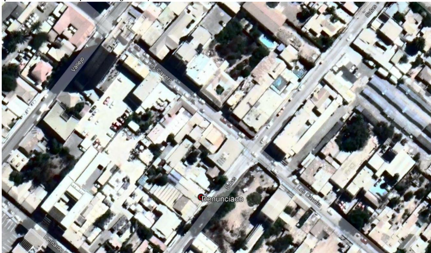
Figura 1. Mapa de ubicación local (Fuente: Google Earth).

Coordenadas UTM de referencia: DATUM WGS 84