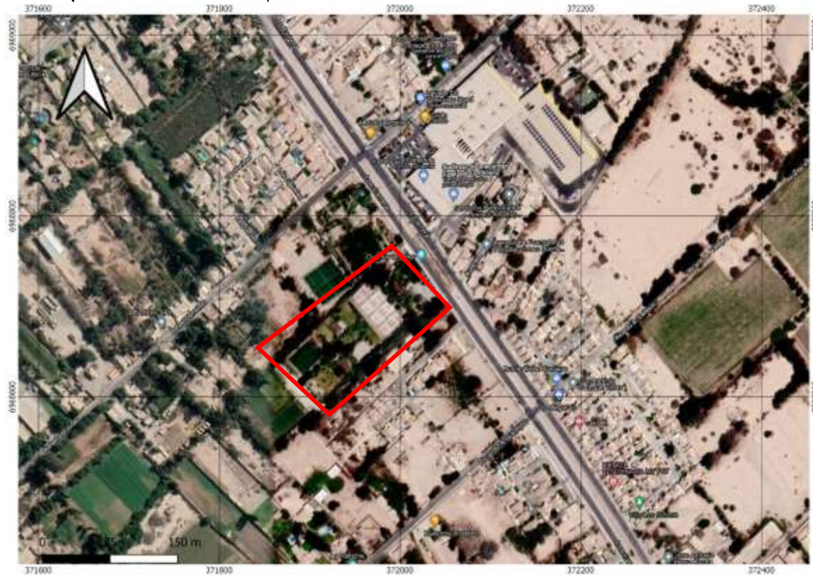
Figura 1. Mapa de ubicación local

Coordenadas UTM de referencia: DATUM WGS 84