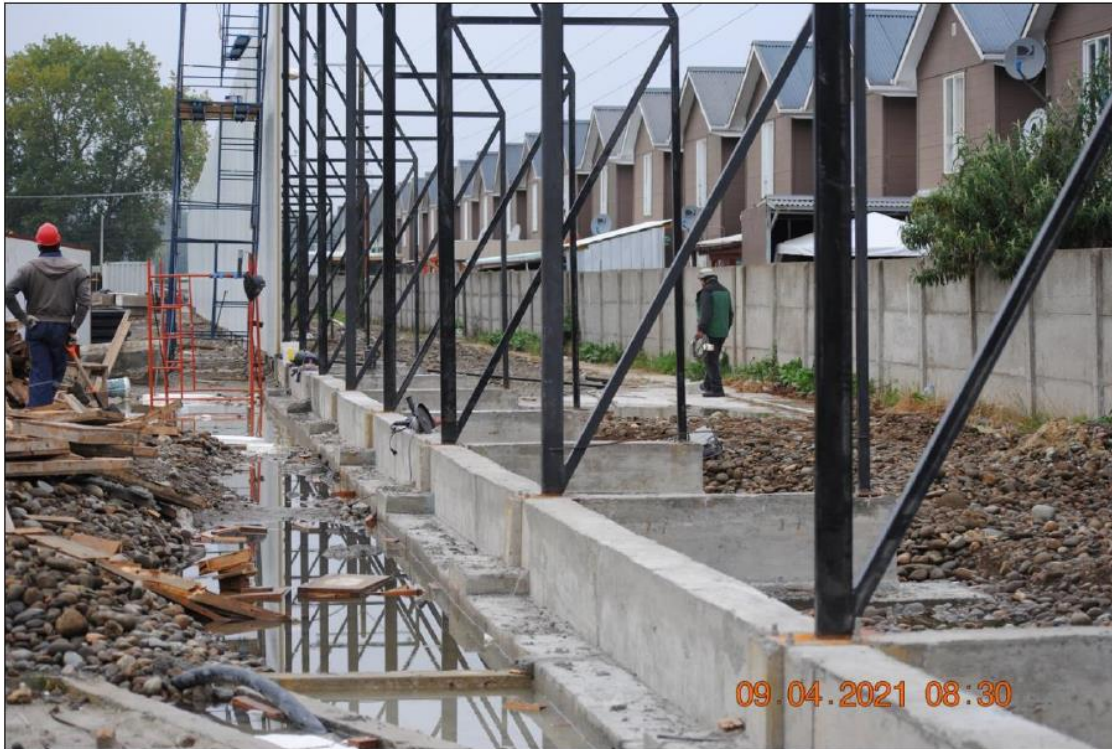
Figura 1. Objeto de regulación de la MP dictada.

Descripción: La MP busca hacerse cargo de las labores de hormigonado necesario para la instalación de un muro de insonorización. La Figura 1 da cuenta de faenas de construcción del muro, su relación de colindancia con el conjunto habitacional Torreones IV, y las labores de fundación del muro. Es el ruido provocado por esas labores, de las que pretende hacerse cargo las medidas provisionales dictadas por la SMA.