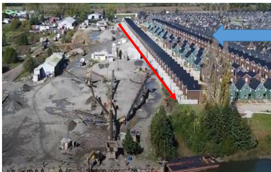
Conjunto habitacional Torreones IV

Con fecha 15 de enero de 2021, una parte interesada en el procedimiento sancionatorio ya mencionado realizó una presentación reiterando que los problemas inicialmente denunciados se mantendrían en el establecimiento, requiriendo se rechazara la implementación de un muro de insonorización acústica que se construye en línea paralela a la pandereta que delimita el predio de la extracción de áridos y las viviendas de los denunciados. Denuncian que la maquinaria utilizada para su construcción se instala muy cercana a sus residencias (en rojo ubicación referencial del muro de insonorización).