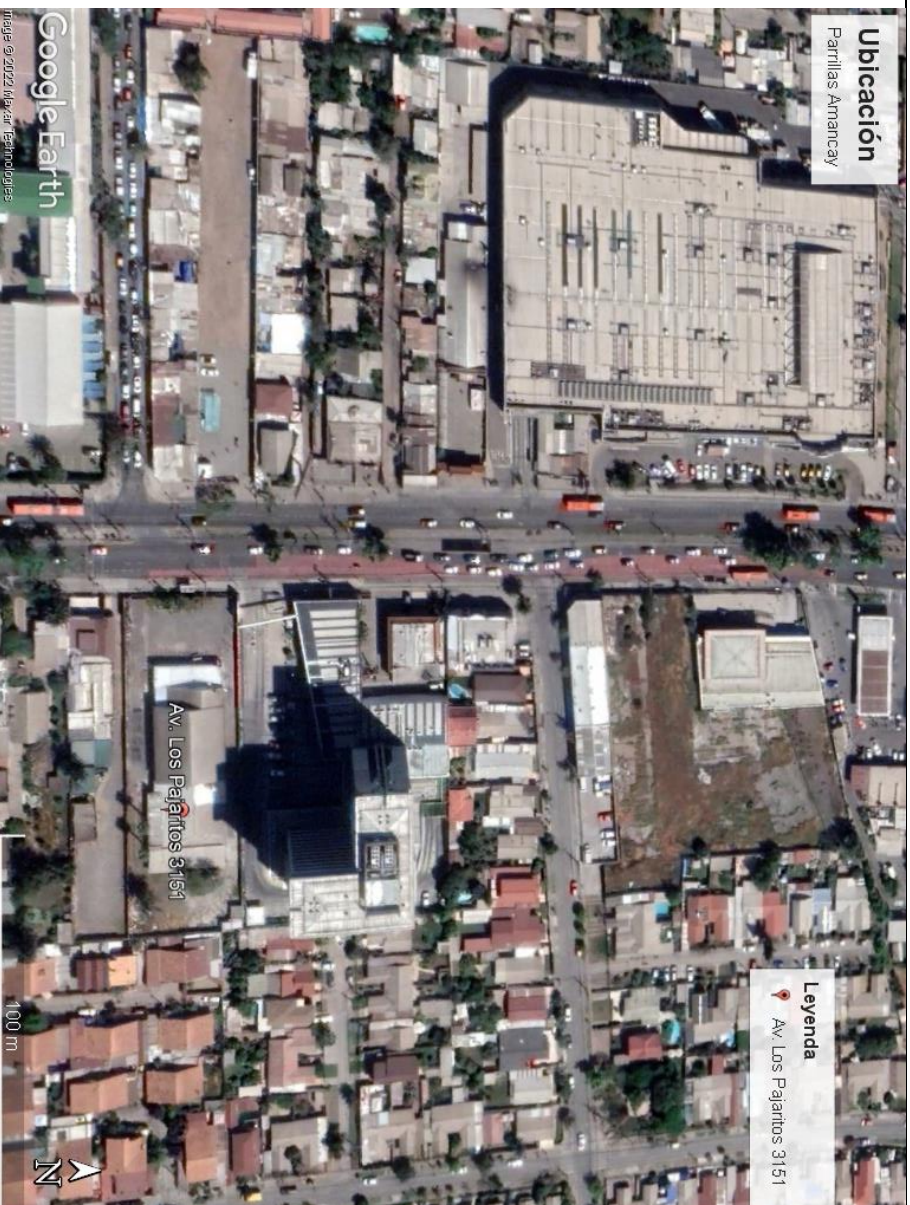
Imagen 1. Ubicación Fuente: