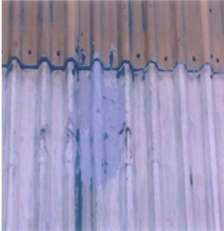
Figura 2: Detalle Sello en portón.