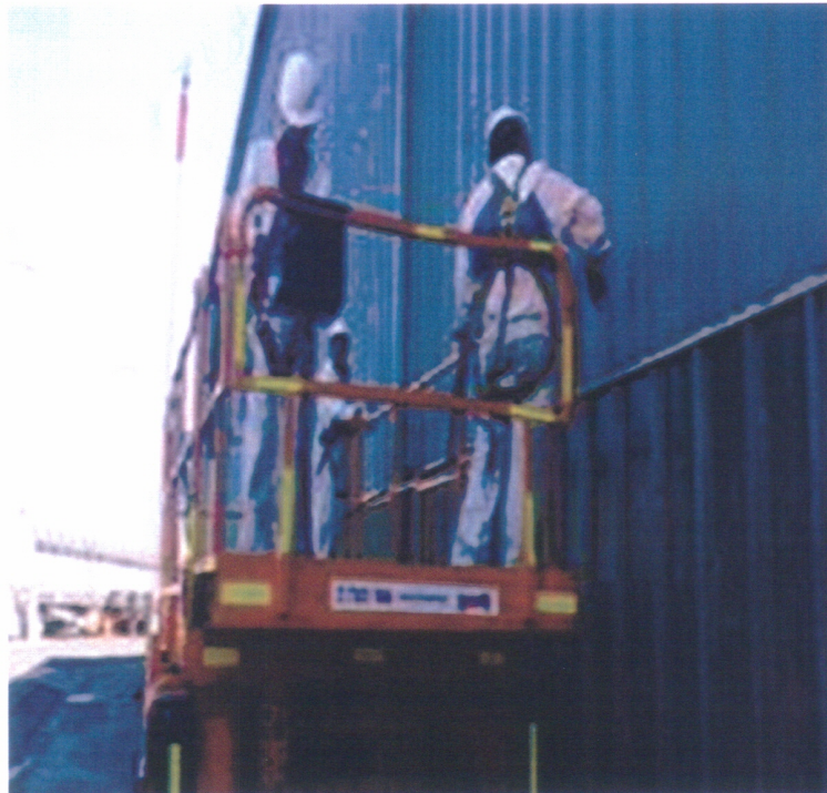
Figura 1: Cuadrilla sobre plataforma realizando trabajos de sellado del portón del edificio SAC.

Se adjunta detalle fotográfico de los trabajos realizados, y en anexo O.C de los trabajos realizados.