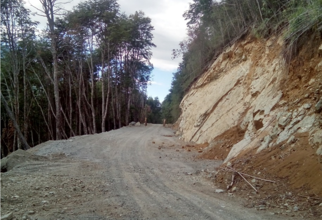
Km 13,6 Coordenadas 19G 255.001 E – 5.384.727 N. Sector en construcción con peligro de Derrumbe