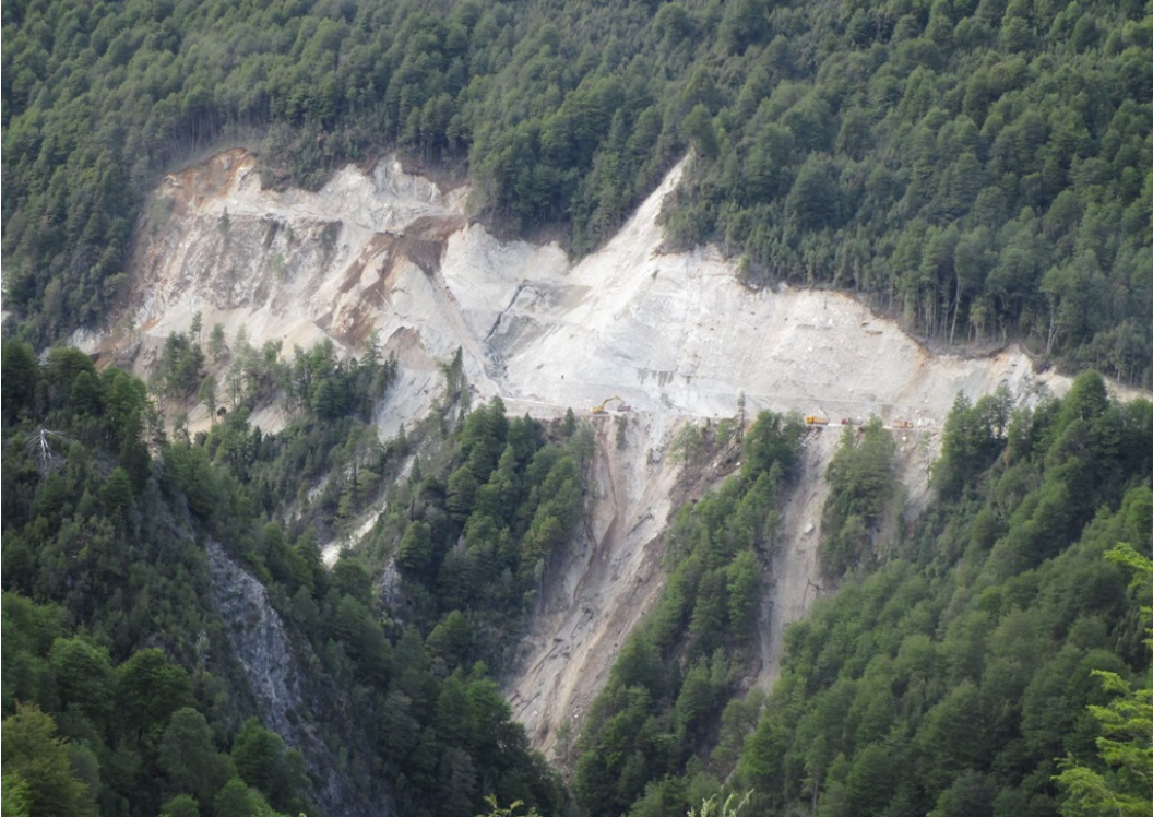
Km 14,4 Talud en construcción Tigre Sur, Coordenadas 19 G 255.688 E – 5.384.308 N. Vista desde el Noroeste , Ladera Tigre Sur