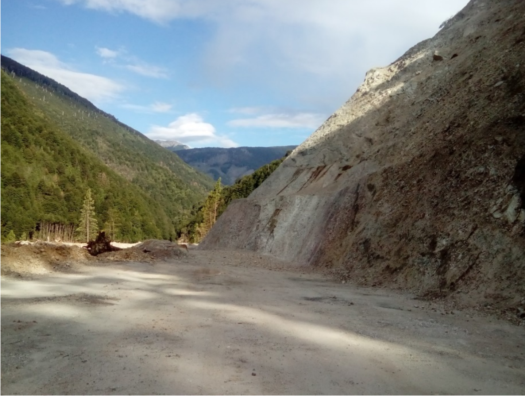
Km 14,4 Talud en construcción Tigre Sur, Coordenadas 19 G 255.688 E – 5.384.308 N.