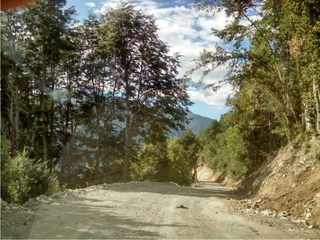
Km 11,0 Coordenadas 19G 254.663 E – 5.382.309 N.