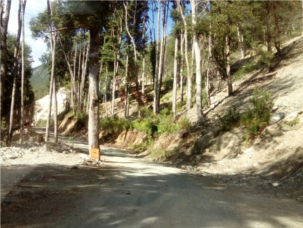
Vista Baldovino Norte, Km 8,67 Coordenadas 19G 254.454 E – 5.380.556 N.