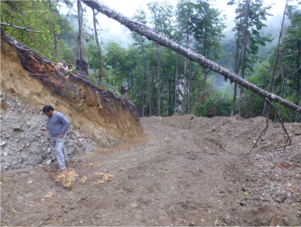
Sector rio Tigre Coordenadas 19G 255.281 E – 5.384.768 N.