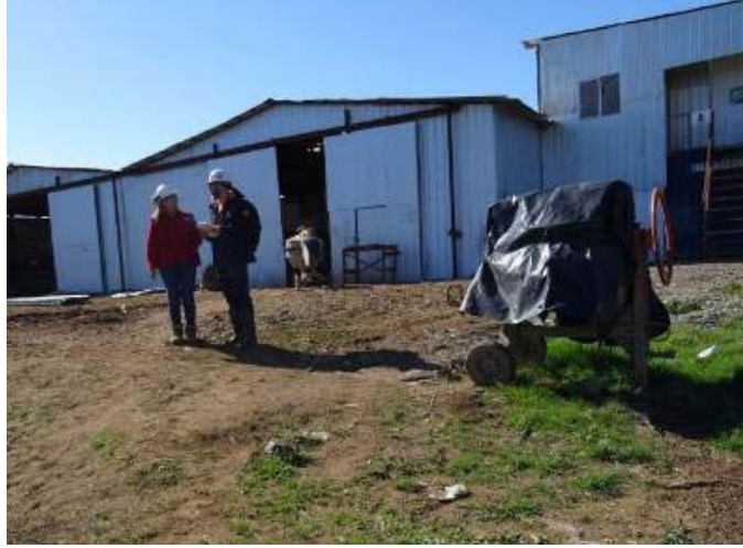
Parte de la instalación de faenas de la empresa al momento de la inspección.