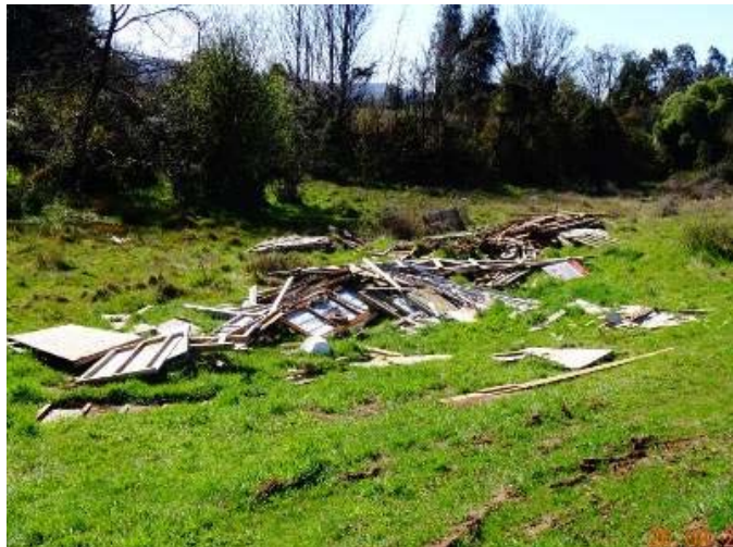
Residuos esparcidos en un sector del predio (despunte, latas, maderas).