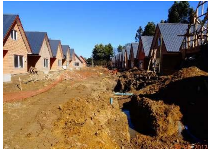
La fotografía muestra una vista de parte de las casas hasta esa fecha construidas.