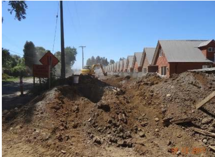
Esta fotografía muestra la retroexcavadora realizando trabajos de relleno en obras de alcantarillado.