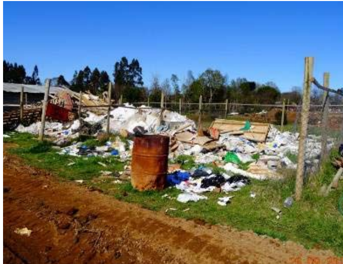
Sector de acumulación de residuos, sin ningún tipo de segregación u orden.