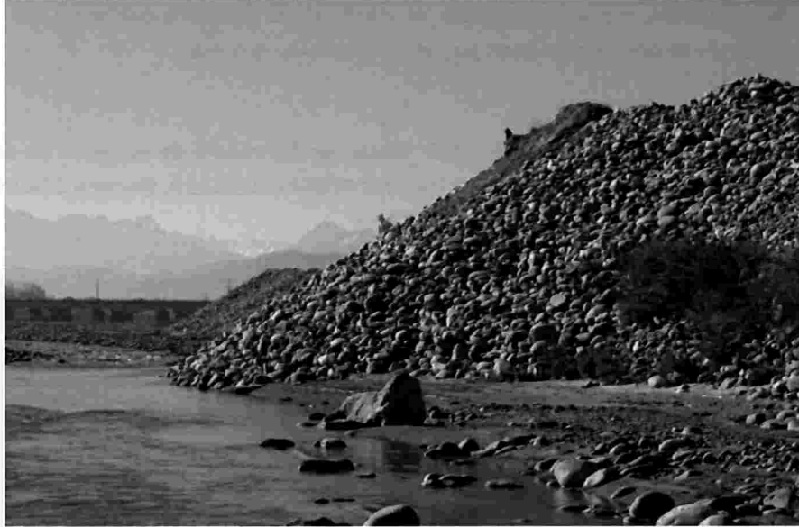
Imagen N° 6 de fecha 25 de mayo de 2018. Derrumbe de material de descarte hacia caja del río, coordenadas UTM DATUM WGS84 HUSO 19, Norte 6.214.907, Este 337.520. 17

Asimismo, el IFA DFZ-2018-1922 VI RCA da cuenta de que en los informes enviados por parte del titular 18 tampoco se observan avances respecto a la disposición correcta del material de descarte y acopios de bolones .