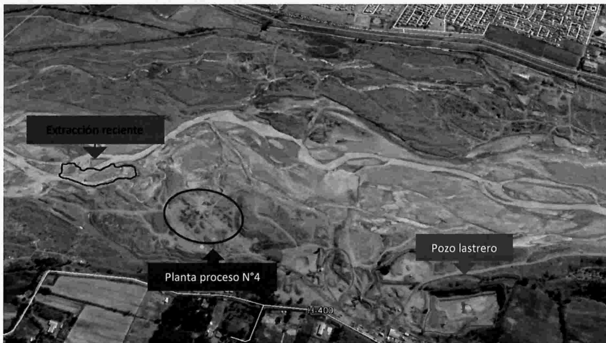
Imagen N° 3 de 25 de mayo de 2018. Sector pozo lastrero, encerrados en rojo, extracción reciente encerrada en morado y planta de proceso N° 4 encerrada en azul, coordenadas UTM DATUM WGS 84 HUSO 19, Norte 6.215.112, Este 336.109. 9

Respecto a la entrega por parte de la empresa de videos de sobrevuelo de dron como medio verificador de la detención de funcionamiento de toda actividad extractiva 10 , el IFA DFZ-2018-1922 VI RCA señala lo siguiente: