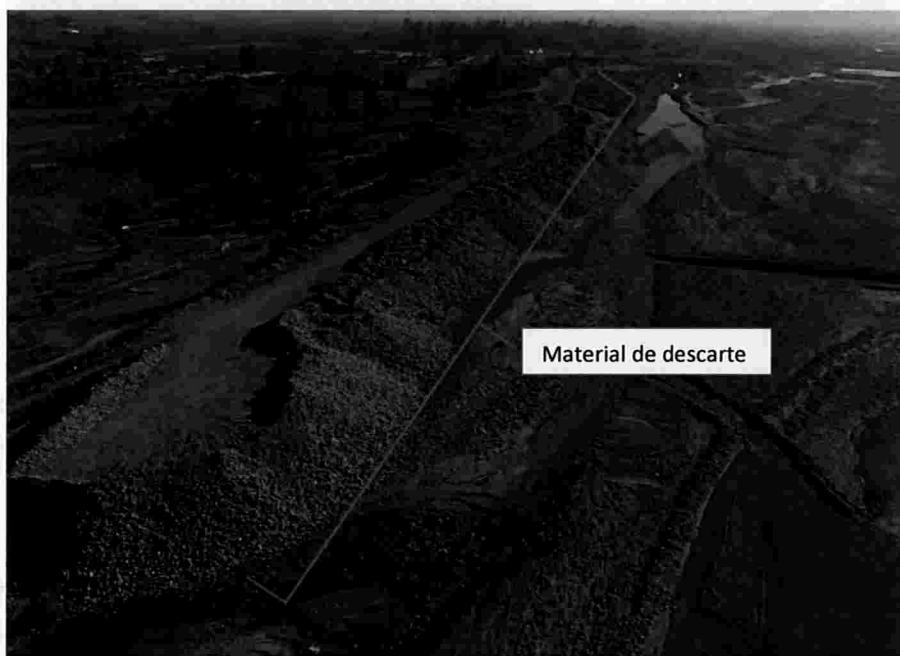
Imagen N° 5 de fecha 25 de mayo de 2018. Situación del acopio de material de descarte observada a la fecha, coordenadas UTM DATUM WGS84 HUSO 19, Norte 6.214.907, Este 337.520. 16

Asimismo, respecto a este punto, el informe agrega que durante actividad de inspección se observó un derrumbe del material de descarte hacia la caja del río en coordenadas WGS 84 huso 19 6214907N 337520E (énfasis agregado).