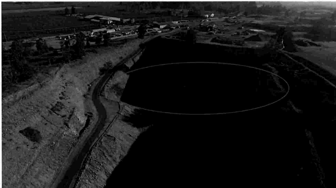
Imagen N° 2 de 25 de mayo de 2018. Sector pozo lastrero, encerrados en rojo se encuentran máquina retroexcavadora y camión. Para mayor claridad de la imagen, ver video de sobrevuelo DGA, minuto 5:22 a 7:40, donde se puede apreciar entrada y salida de camiones, coordenadas UTM DATUM WGS 84 HUSO 19, Norte 6.214.738, Este 337.255. 7

Asimismo, señala que durante actividad de inspección del día 23 de mayo de 2018 8 , se observó la existencia de polígono de extracción reciente , cercano a planta de proceso N°4 (identificada por el titular como parte de Áridos Cachapoal Ltda.), con una coordenada central de referencia WGS 84 huso 19 6215112N 336109E. Lo anterior, es demostrado a partir de lo observado en el siguiente medio de prueba.