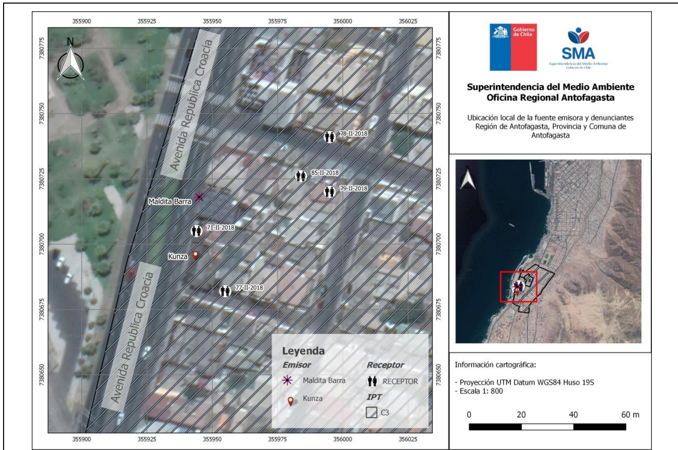
Figura 1. Ubicación fuente emisora y denunciantes. La Medición se realizó en el Receptor 1 (Denuncia ID 71-II-2018)