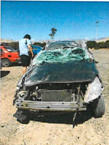
vehiculo remolcado.jpeg 136K